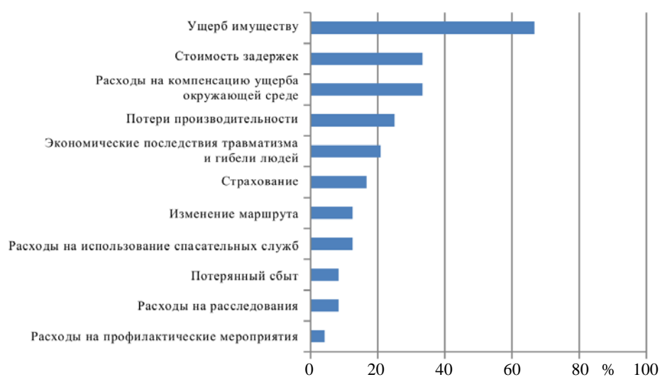
Рис. 1. Тип издержек, регистрируемых для отдельных аварий на железнодорожных переездах [4]