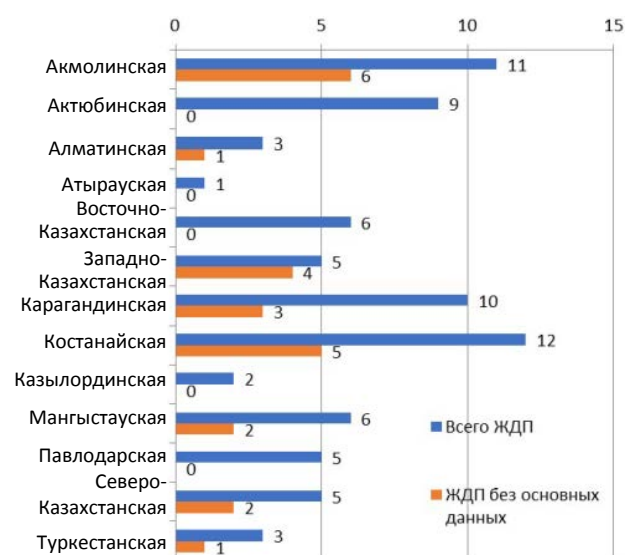
Рис. 3. Распределение железнодорожных переездов по областям с отсутствием части данных

Обработка полученной информации показала, что даже минимальный набор данных в ряде случаев собрать не представлялось возможным. Всего удалось собрать информацию для 69 % переездов. Для 24 железнодорожных переездов большинство данных, включая основные (категорию, наличие охраны), отсутствует. Распределение таких переездов по областям приведено на рис. 3.