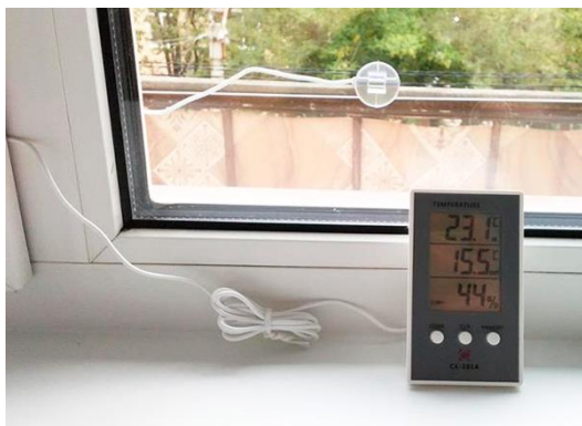
Рис. 4 - Домашняя метеостанция

1. Мобильная метеостанция. Мобильная метеостанция представляет собой устройство, которое состоит как минимум из двух блоков (рисунок 1). Первый из них представляет собой главный блок с дисплеем, на котором выводятся проанализированные данные. Вторая часть является выносным датчиком, измеряющий текущие показания для прогнозирования изменения погодных условий. Центральный блок устанавливается в помещении, а система датчиков выводится на улицу под открытое небо и фиксируется в любом удобном месте, где она не будет мешать.