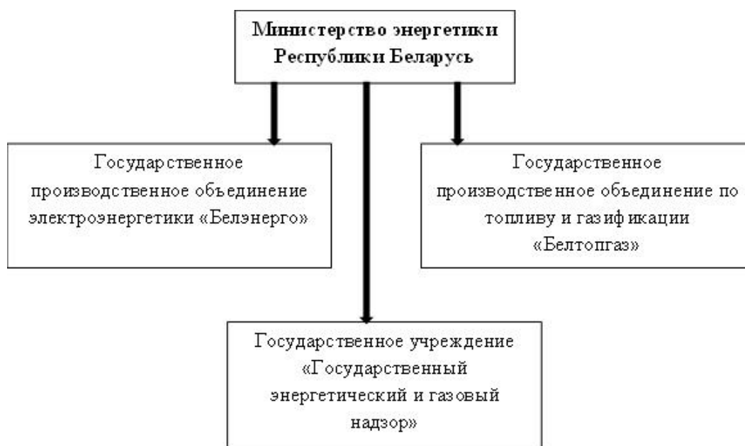
Рисунок 1 – Организации, подчиненные Министерству энергетики Республики Беларусь

Органом государственного управления, который осуществляет регулирование энергетической политики страны, является Министерство энергетики. Министерству энергетики Республики Беларусь подчиняются следующие государственные организации (рис. 1) [1,2]: