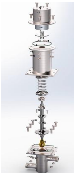
Рис. Электромагнитный клапан

Белорусский национальный технический университет