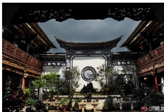
Рис. 1. Архитектурный декор жилого дома народности Бай

использовать для создания колористических композиций различные цвета. Здания народности Бай уникальны по своему дизайну. Резьба по дереву используется на решетчатых воротах, горизонтальных портьерах, облицовочных плитах стен и др., чтобы показать национальную культуру. Сюжеты из фауны, такие как летучие мыши и нефритовые кролики, используются изобретательно, с разнообразием форм, и многие из них являются высокохудожественными, чтобы выразить видение красоты природы. Что касается украшения цветной росписью, то в Бай-архитектуре более распространена «белая настенная роспись». Этот вид украшения обладает сильным этническим очарованием, а кирпичные столбы и черепичные части стены используются для покраски. Стена белая, а элементы карнизов покрыты разноцветными картинами разных размеров. Декоративные полосы различного цвета, с изображением цветов, гор и рек, птиц и животных, или письменные тексты выражают эlegantный вкус и понимание эстетики владельцем каждого жилого дома (рис. 1).