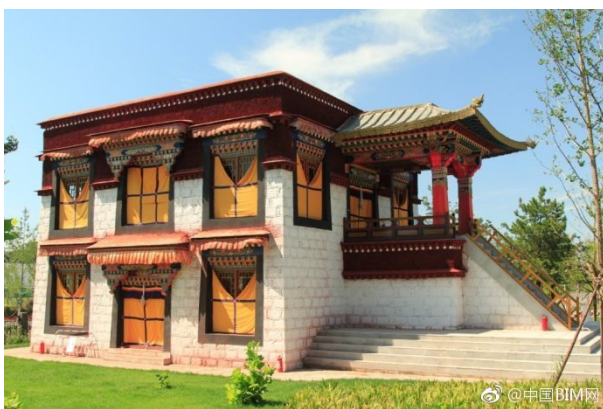
Рис. 2. Архитектурный декор жилого дома народности Тибетцы

Большие и маленькие двери и окна в основном окрашены черными трапециевидными рамками, а внешний вид их привлекателен своей уникальностью. Религиозно значимое украшение – самый известный и узнаваемый символ тибетских домов: красные, синие и белые полосатые занавески висели под маленькими карнизами на дверях и окнах в наружных стенах. Оконные проемы вокруг и переплеты окон окрашены темным цветом, часто черным. В декоре зданий фиксируются полосы красного, белого, синего, желтого и зеленого. В Тибетской религиозной колористике пять цветов представляют огонь, облако, небо, землю и воду соответственно, и являются выражением благоприятных пожеланий. Тибетцы – народность, которая старается выражать красоту и очень придирчиво относится к украшению своих жилищ. Внутренние поверхности стен тибетских домов в основном расписаны узорами, стены жилых комнат в интерьерах окрашены в синий, зеленый и красный цвета. Имеющая культовое назначение буддийская комната, – фактически храм, является самой важной в каждом доме. Колонны храма окрашивали в ярко-красный цвет, а капители колонн и деревянные балки должны быть синими снизу, и на них должны быть нарисованы различные традиционные узоры (рис. 2).