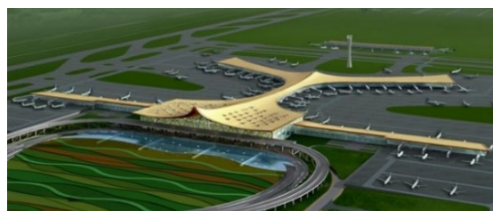
Рис. 3. Международный аэропорт Куньмин Чаншуй в Куньмине: а – главный фасад; интерьер зала; в – общий вид аэропорта

Если смотреть на главный фасад аэропорта, то обращает на себя внимание его крыша темно-желтого цвета, похожего на цвет бамбука, который является абсолютно обычным строительным материалом в народной архитектуре, вплоть до возведения забора. При этом скаты крыши расположены изогнуто вниз, подобно форме елочки. Крыша была специально предусмотрена с подсветкой во время проектирования. Устроенные на крыше световые фонари, хорошо пропускают свет и действуют как естественный источник освещения помещений. В то же время фонари дают своеобразное разрежение изогнутым поверхностям крыши, визуальное воспринимаемое в интерьере. Световой эффект, создаваемый фонарями в форме полосы, удачно и к