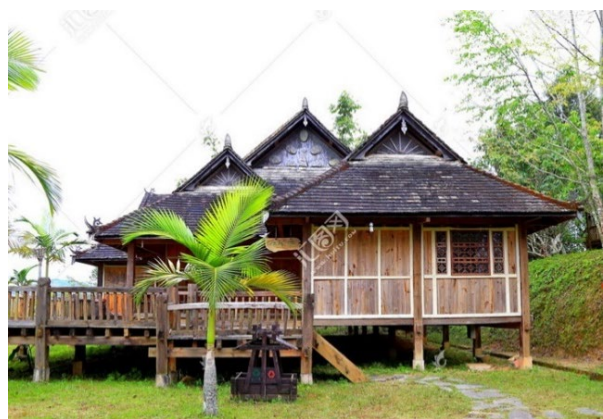
Рис. 3. Архитектурный декор жилого дома народности Дай

Будучи продолжением простейших форм ранней архитектуры, свайные жилые здания не являются вершинами строительного мастерства, но сохраняют простую и естественную сущность архитектурно-конструктивных решений и демонстрируют «наивную и живую» эстетику первобытной культуры. Среди зданий различных народностей в Юньнани свайные жилые дома наименее украшены цветом. Например, в свайных жилых зданиях народности Дай в автономной префектуре Дэхун в провинции Юньнань основной объем здания, двери и окна, перила и украшения выполнены из натуральных материалов без облицовки, сохраняя первоначальные цвета материалов и кажутся очень простыми. Однако несложная структура свайных жилых зданий и возможность изменять их внутренние пространства, причем вместе с формой крыши, делает возможным создание достаточно сложных форм. Декорация здания сосредоточена на крыше. Через украшения конька крыши и фронтовой ее части представлены различные этнические особенности. Например, народность Дай поклоняется павлинам, и в их украшениях часто используются элементы, связанные с этими птицами (рис. 3).