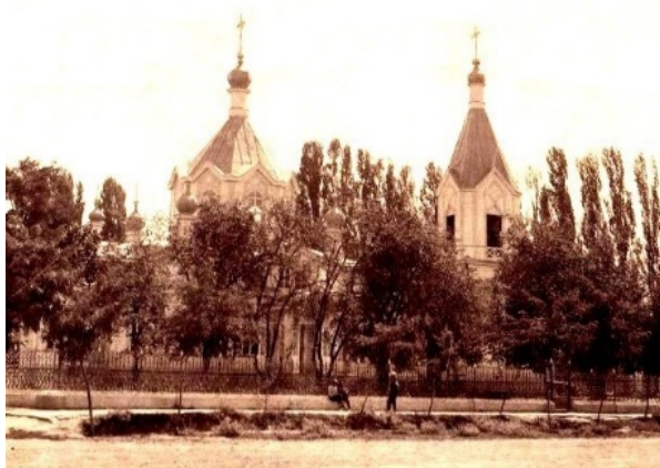
Рис. 4. Славянск-на-Кубани. Церковь Пантелеимона Целителя, начало XX в.

лись культовые сооружения и при этом в данных поселениях не найти одинаковых храмов (рис. 4).