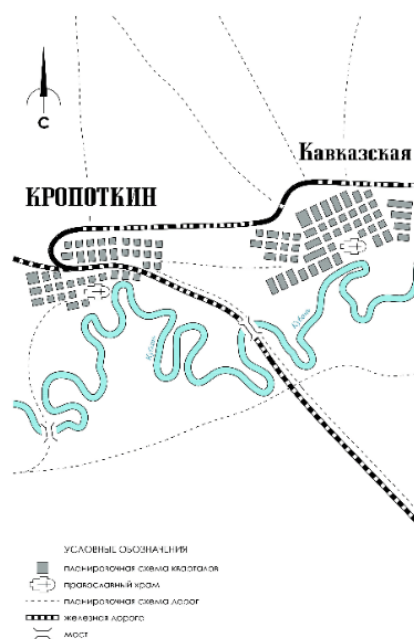
Рис. 2. Планировочные схемы поселений Кубани в начале XX в.

Одновременно возникает острая необходимость усиления экономико-хозяйственного освоения южного региона и формирование гражданских поселений, которое происходит в рамках планировочно-композиционного аспекта преобразования оборонительных сооружений данных населенных мест. В дальнейшем, сложившаяся планировочная структура поселений Кубани представляла собой уже ряд населенных пунктов, сосредоточенных преимущественно вдоль основных прокладываемых дорог (Новороссийск-Сухум), железнодорожной магистрали (Северо-Кавказская железная дорога) и водных объектов (р. Кубани, Адагум, Белая, Пшеха, Тихонькая и др.).