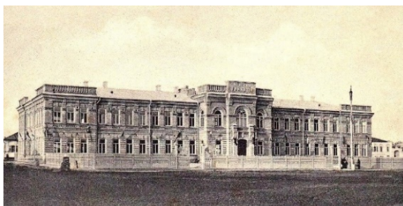
Рис. 5. Здание женской, Ксенинской гимназии Ейска с домовым храмом Константина и Елены

Первоначально, до возведения православного сооружения станичникам приходилось молиться в походной разборной церкви. При этом в последствии даже в зданиях образовательных учреждениях были домовые храмы, настолько духовна православная вера у казаков (рис. 5).