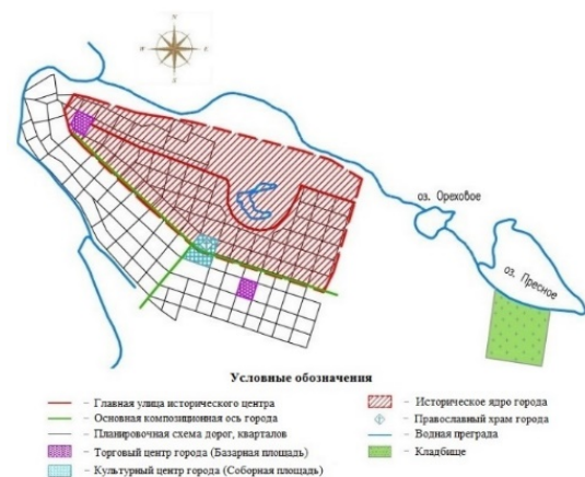
Рис. 3. Схема исторического ядра г. Темрюка на современном плане

Исторический центр поселения располагался в наиболее благоприятном в природном отношении месте (возвышенность, берег водоема, водотока), либо размещался на пересечении основных магистралей. Вместе с тем неизменным оставалось ядро исторического центра населенного пункта, в котором размещены наиболее выдающиеся памятники архитектурного наследия, посредством которых лучше понять современную действительность для создания в целом устойчивого развития среды жизнедеятельности городского поселения (рис. 3).