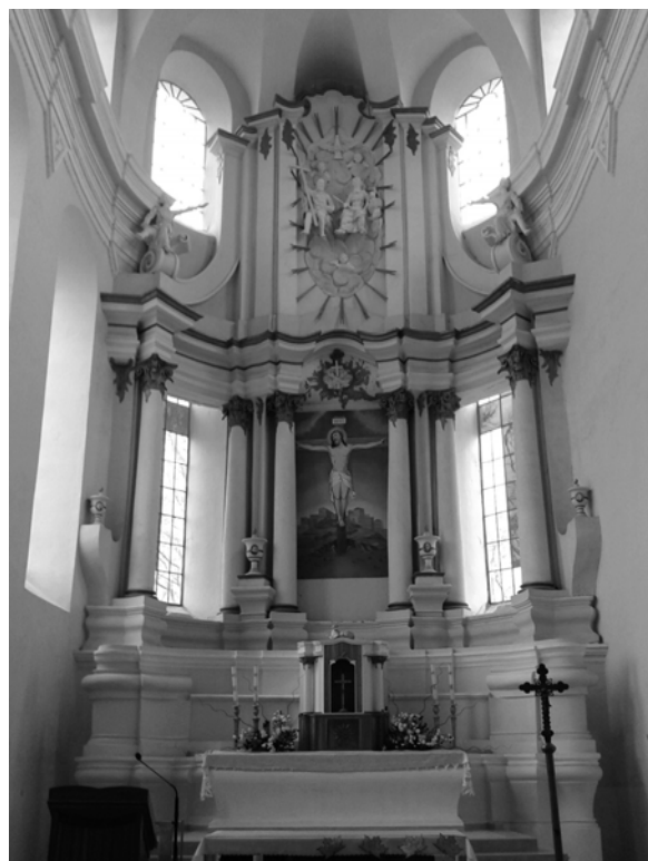
Рис. 1. Главный алтарь костела бернардинцев Друха

В ходе дополнения часто возникает вопрос в какой степени нужно восстанавливать алтарные наставы, утратившие некоторые свои части или декоративные элементы и необходимо ли возвращать их в первоначальный вид [4, с. 15–23]. Дополнение можно считать наиболее оправданным в тех объектах, где сохранился остов (структура) алтарной наставы, но отсутствуют скульптуры и детали, однако при этом известны обмеры или существуют фотографии ее аутентичного состояния алтарной наставы. Пример такой реконструкции можно было бы осуществить в бернардинском костеле в Друре (рис. 1-2).