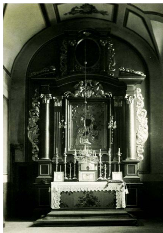
Рис. 5. Боковой алтарь костела доминиканцев в Новогрудке, до 1939 г.

хранившимися интерьерами, при этом нет никаких сведений о том, каким было их первоначальное убранство. В связи с этим часто возникает вопрос использовать ли современные формы или придерживаться барочной архитектуры? Практика показала, что применение ордерной системы и барочных элементов современными мастерами ведет к искажению форм и не приносит желаемого эстетического восприятия. Наилучшим вариантом является проект, исполненный в современных формах, не наследующих стиль барокко и рококо. Одновременно возникают проблемы, связанные с функциональными, теологическими, этическими и эстетическими задачами [5, с. 31–35]. Поэтому, опираясь на теологические знания, необходимо руководствоваться принципом использования общепринятой христианской символики.