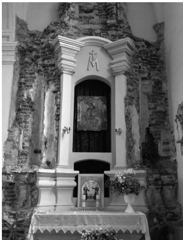
Рис. 2. Боковой алтарь костела бернардинцев, Друя

ния самого костела этот объем используется как каплица, в которой проводятся богослужения. Внутри сохранился остов кирпичного умывальника – Лаватера (lavabo) в архитектурной форме, наследующей алтарную наставу. Конструкция сохранила некоторые украшения из стукко, но утратила свою венчающую часть (рис. 3).