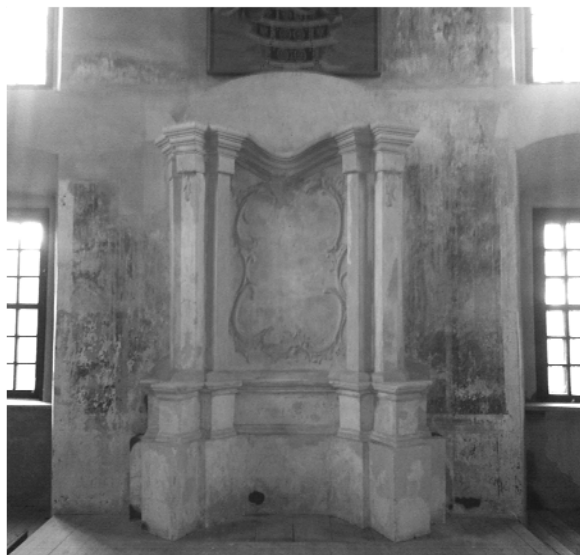
Рис. 3. Бывший лаватер в сакристии костела кармелитов обутых в Мстиславле

В сложившихся обстоятельствах предлагается провести ремонтно-реставрационные работы по восстановлению утраченных частей архитектурных обломов и покрасить всю малую архитектурную форму известковой краской, имитирующей цвет разных оттенков песчаника. Такое цветовое решение рекомендуется применить с целью общего восприятия интерьера в едином контексте «духа старины». Верхнюю часть объекта предлагается восполнить деревянным картушем с овальной картиной в центре (рис. 4). Такое решение несмотря на то, что оно придает законченный вид объекту, одновременно указывает на более позднее создание этого элемента.