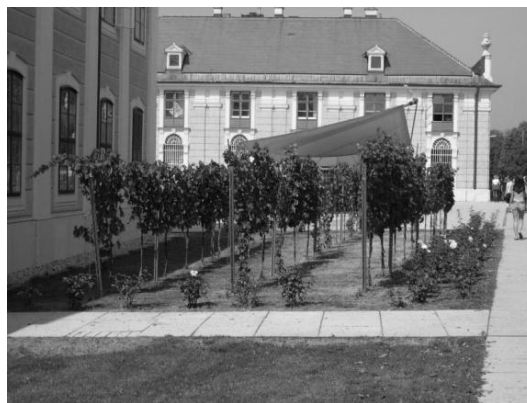
Рис.4. Фрагмент декоративного оформления пешеходной зоны рядами виноградной лозы

Первая очередь реконструкции. Первая очередь реконструкции аванплощади Шенбрунна была проведена в 2005 году и затронула главный внешний двор, а также зону пешеходного движения с историческим рядом каштанов. Проект был выполнен архитектурно-ландшафтной компанией «Auböck & Kárász» (арх. Clemens Kolar) совместно с архитектурной компанией «A&A architecten». Заказчиком работ выступила организация ООО «Дворец Шенбрунн». В ходе ландшафтной реконструкции в зоне внешнего двора и пешеходного движения вдоль исторического каштанового ряда асфальтовое покрытие было заменено на покрытие из крупногабаритных бетонных плит. На участке под каштановыми деревьями было предусмотрено гравийное покрытие, позволяющее не нарушать воздухо- и водообмен корневых систем, а также препятствовать уплотнению почвы вокруг корневых систем вследствие интенсивного пешеходного движения. Было обновлено газонное покрытие и участки с декоративной растительностью (рис.4). В качестве декоративного материала была использована виноградная лоза, традиционное для Австрии культурное растение.