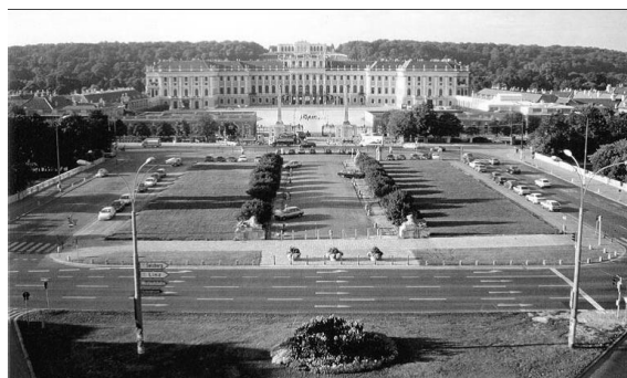
Рис. 3. Аванплощадь Шенбрунна до реконструкции [7]

Реконструкция аванплощади Шенбрунна. На территориях, прилегающих к ансамблю, складывается сложная градостроительная ситуация. Здесь пересекаются транспортные и пассажиропотоки городского, рекреационного и туристического значения.