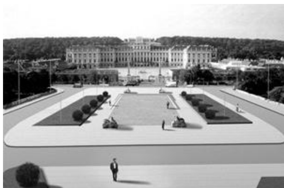
Рис.5. Проект реконструкции площади («Auböck & Kárász»)[7]

томобильного транспорта была вынесена с площади.