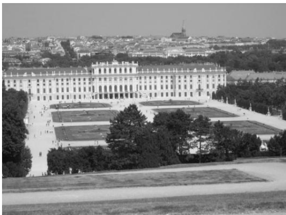
Рис.1. Перспектива с Шенбрунновского холма на дворец, Большой партер и Вену

На охотничьей территории был построен трехэтажный загородный замок в итальянском стиле, который в последующие годы стал королевской резиденцией. Впервые резиденция была названа «Шенбрунном» в 1642 году. В этот период супруга императора Фердинанда I (1578-1637) Элеонора фон Ганзаго устраивает в парке пышные придворные праздники и садовые театральные представления. Блистательное время пришло к концу в 1683 году, во время второй осады Вены, когда дворец и парк были сравнены с землей.