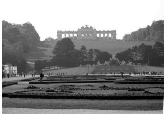
Рис. 2. Большой партер, Фонтан Нептуна и Глорietta парке Шенбрунна

После смерти Марии Терезии интерес к парку был несколько утерян. В XIX столетии, во время правления Франца Иосифа (1830 — 1916), Шенбрунн вновь переживает период расцвета. На долгие годы он вновь становится императорской загородной резиденцией. Одичавшему парку возвращается прежний регулярный облик, который сохранился и до наших дней.