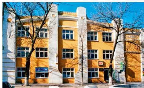
Рис. 6. Ейский историко-краеведческий музей им. В.В. Самсонова, один из старейших музеев Краснодарского края, основан 5 мая 1910 г.

указанное наследие, но значительно увеличивает его, дает возможность всесторонне показать его.