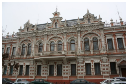
Рис. 5. Краснодарский государственный историко-археологический музей-заповедник имени Е. Д. Фелицына. г. Краснодар, ул. Гимназическая, 67 (Первонач. – Дом купцов братьев Х.П. и К.П. Богарсуковых. Годы постройки – 1900–1901)

Вместе с тем важное место в познании историко-культурного наследия занимают коллекции этнографических, историко-краеведческих и историко-архитектурных музеев. Эта перспективная новаторская концепция, которая может быть успешно реализована в сфере музейного туризма, учитывая тот факт, что на территории Кубани расположено большое количество данных музеев. Примечательно, что и сами музеи в большинстве случаев являются объектами историко-культурного наследия (рис. 5-6).