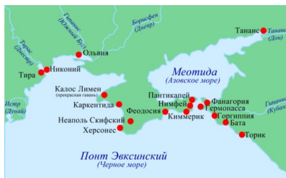
Рис. 4. Греческие города-колонии в Северном Причерноморье в античную эпоху [9, с. 199]

«Боспорское царство – античное государство, объединившее в древности греческие колонии Восточного Крыма (Боспор Европейский) и Таманского полуострова (Боспор Азиатский), а в первые века н. э. – г. Танаис в устье Дона» [8, с. 66]. При этом «история отечественного градостроительства, еще до нашей эры представлена такими южными городами как: Фанагория, Танаис, Синдская Гавань, Гермонасса и т.п., появившимися на восточной части Боспорского царства» [9, с. 198], а «рубеж нашей эры – один из самых сложных и интересных периодов Боспорского царства» [10, с. 7] (рис. 4).