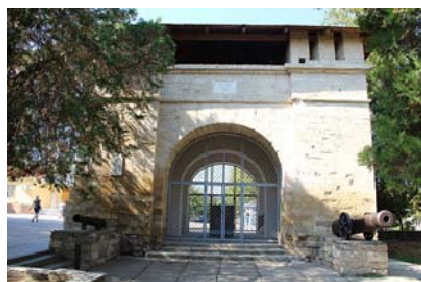
Рис. 2. Анапа, Высокий берег. Памятник архитектуры XVIII в. «Русские ворота» – часть сохранившейся крепости. Своеобразный вход в существующий городской парк на набережной

Память о прошлом обеспечивает связь времен, способствует духовному обогащению человека, воспитывает уважение к традициям [2, с. 56].