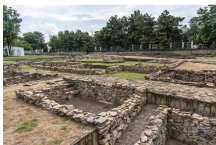
Рис. 1. Уникальный раскоп древнего античного города Горгиппия (совр. Анапа)

Уникальными произведениями архитектуры являются памятники историко-культурного наследия, представляющие определенную историческую эпоху, в которой были созданы, привлекающие внимание своими художественными качествами, т. е. сочетанием различных аспектов [1, с. 47] (рис. 1–2).