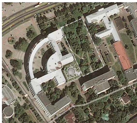
Рис. 1. Фрагмент территории Академгородка с реконструируемым сквером

Архитектурно-планировочная среда комплекса НАН включает территорию, имеющую в плане размеры 332x794x60x824 м. Она расположена в северо-восточной части г. Минска, между улицами: пр. Независимости, Академической и Сурганова. Она включает зеленую зону (сквер), размерами в плане 50x120 м, здание Президиума НАН, административные и научно-исследовательские здания и здание библиотеки им. Я. Колоса (рис. 1).