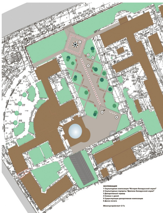
Рис. 6. Планировочное решение по варианту 1

Было разработано два варианта решений сквера: вариант 1 (рис. 6, 7), вариант 2 (рис. 8, 9). Согласно варианту 1, был предусмотрен выход на пр. Независимости и скульптурная композиция размещалась в передней части сквера.