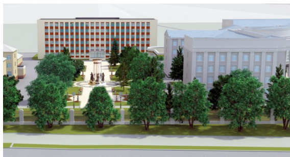
Рис. 9. Визуализация варианта 2