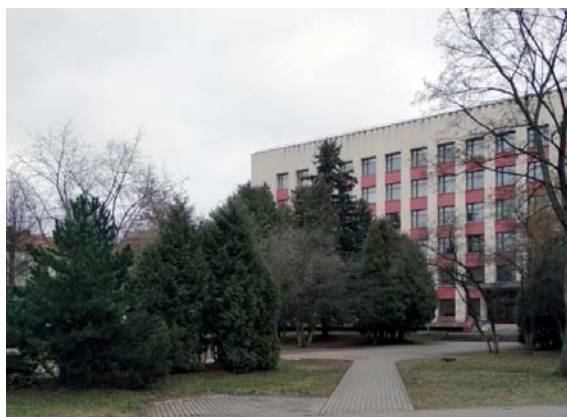
Рис. 3, 4, 5. Виды растений, произрастающих на территории сквера

Общественно-функциональное значение пространства минимально. Существующий сквер не имеет законченного и выраженного планировочного решения и