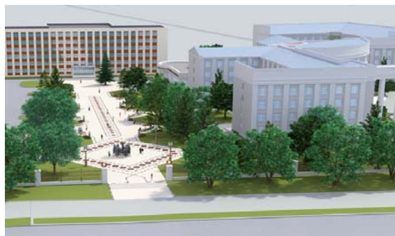
Рис. 7. Визуализация варианта 1

Согласно варианту 2, предусматривалось заглубленное размещение композиции «Золотое кольцо белорусской науки». Варианты предусматривали различную геометрическую планировку и рисунки мощений.