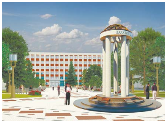
Рис. 11. 3D модель композиции «Золотое кольцо белорусской науки»

– разработка индивидуальных малых архитектурных форм, соответствующих стилистике зданий.