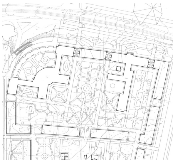
Рис. 2. Фрагмент эскизного проекта территории Академгородка 1951 г.

Здание главного корпуса (пр. Независимости, 66), административный корпус (пр. Независимости, 68) и декоративная ограда входят в список историко-культурного наследия (712ГООО198 кб 2.3), территория сквера относится к зоне охраняемого ландшафта. В 1951 году в институте «Белгоспроект» был разработан эскизный проект застройки всего участка Академии Наук БССР (арх. Хегай, рук. Парсаданов) [3]. В ансамбле застройки предусматривались три выхода на основную магистраль г. Минска - пр. Независимости (в 1951 г. - ул. Пушкина) (рис. 2). Расположение выходов на основную магистраль увязывалось с композицией сквера. Проект не был выполнен, комплекс застройки Академии наук сейчас выглядит иначе.