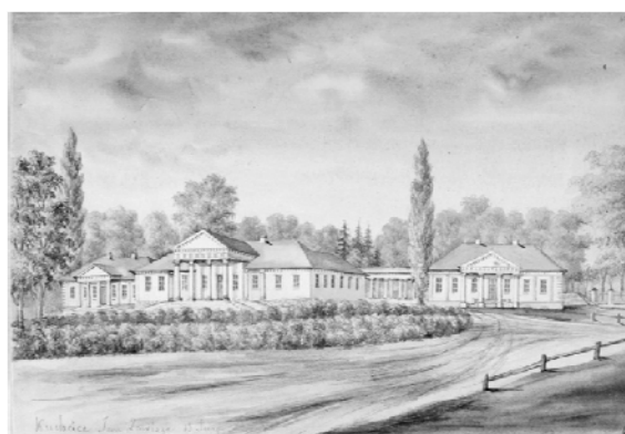
Рис. 4. Усадебный дом К. Завиши в Кухтичах (1779 г., арх. К. Спампани). Рис. Н. Орды

Кроме построек К. Спампани на белорусской земле в конце XVIII века возникло значительное число классицистических усадебных домов, среди которых высокими художественными достоинствами отличался дворец графа Л. Тышкевича в Гродно, созданный в течение 1780 года