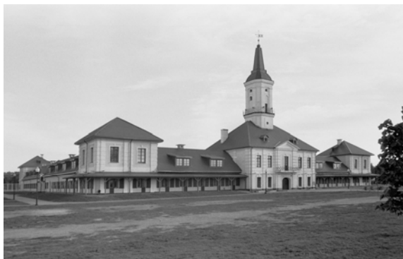
Рис. 2. Ратуша в Шклове (начало 1770-х гг., арх. Я. Фонтана?). Общий вид

В стилистике барочного классицизма в начале 1770-х годов созданы также многие постройки в Шклове, принадлежащем князю А. Чарторыйскому, где до сегодняшнего дня сохранилось лишь здание ратуши, имеющее традиционное для региона объемное построение [4] (рис. 2).