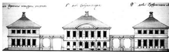
Рис. 7. Дом губернатора в Полоцке (1784 г., арх. И. Зигфриден). Главный фасад

Реализация проектов регулярной перепланировки городов сопровождалась, особенно в губернских городах, активным строительством зданий новой администрации. Создателями этих построек являлись губернские архитекторы И. Зигфриден и И. Зейдель. Эти зодчие, воспитанные на традициях архитектуры барокко, находясь на государственной службе, вынуждены были следовать стилистике вводимого руководством страны стиля классицизм. В этой связи вполне естественным для них было использование стилистики барочного классицизма, которую они восприняли под влиянием построек в Твери, а также раннего творчества архитектора И.Е. Старова. Наиболее известные примеры тому – комплексы административных зданий в Могилеве и Полоцке (рис. 7).