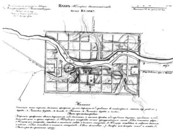
Рис. 6. Проектный план Велижа (1778 г.)

тической стилистике реализовывались в частновладельческих городах, подаренных Екатериной II крупнейшим русским вельможам. Князем Г.А. Потемкиным были урегулированы планировочные построения Дубровно и Кричева [7, с. 173], графом С.З. Зоричем частично было дополнено регулярное построение Шклова. Наиболее же выразительным было классицистическое переустройство Чечерска, где на основе идей Просвещения и масонства возник идеальный классицистический город, наполненный постройками, выполненными в стиле классицизм.