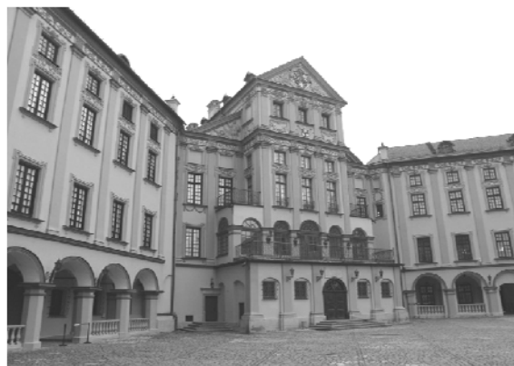
Рис. 1. Дворцово-замковый комплекс в Несвиже (1590-1720-е гг.). Вид главного корпуса

Сапег в Высоком (рис. 1). Конечно же, подобных примеров было намного больше, особенно в интерьерах дворцовых резиденций, однако значительные утраты не позволяют нам назвать многое из того, что было прежде, как это уже сделано для классицистического наследия начала XVIII века на землях Короны [2, с. 97-120].