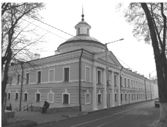
Рис. 9. Здание келий и церкви Богоявленского монастыря в Полоцке (1780-е гг., арх. Дж. Кваренги). Общий вид