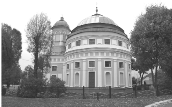
Рис. 10. Церковь Пресвятой Богородицы в Чечерске (1780-е гг.). Общий вид

Заключение. В результате краткого рассмотрения характера развития классицистического стиля, приносимого на белорусские земли с запада и востока, можно сделать следующие выводы: