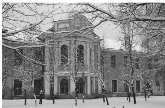
Рис. 3. Дворец короля Станислава Августа в Станиславове (1770-е гг., арх. Дж. Сакко). Вид со стороны парка

К. Спампани. После приезда из Рима он в 1770 – 1773 гг. работал в Вильно в иезуитской академии, а затем с 1774 года по 1783 год – на белорусских землях, где запроектировал и построил усадебные дома в Заславле, Семково, Белице, Бенице, Кухтичах и Радзивиллимонтах (рис. 4). Он фактически стал создателем на белорусской земле нового типа усадебного дома с прямоугольной формой плана, классицистическим портиком на главном фасаде и расположенными по сторонам главного корпуса флигелями, которые зачастую были соединены колоннадами [3, с. 81-88].