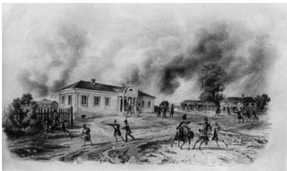
Рис. 5. Усадебный дом в Докшицах (конец XVIII в.). Рис. А. Адама (1812 г.)

варшавским архитектором Ш. Цугом к приезду короля Станислава Августа, а также дворец Р. Бржостовского в Мосаже с богатейшими скульптурными украшениями интерьеров. И здесь следует отметить, что классицистический усадебный дом в конце XVIII века стал неотъемлемой частью белорусского сельского пейзажа и зачастую изображался французским художником Альбрехтом Адамом, который участвовал в 1812 году в военном походе Наполеона на Москву (рис. 5).