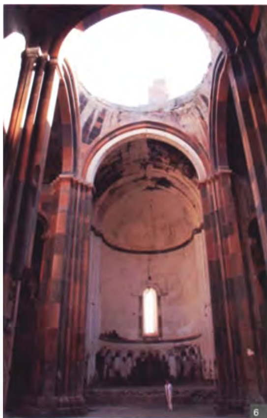
Мал. 6. Інтэр'ер кафедральнага сабора у Ані

Пытанні пра узаемасувязі і узаемаадносінны культур заўсёды паўставалі ў гісторыі мастацтва і архітэктурны. Назвы «уплыў» і «запазычанне» часцей за ўсё насілі негатывны ці нават негатывна-правакацыйны характар. На самой справе працэс узаемадзеяння у развіцці культур з'яўляецца безумоўна станоучым. Ён спрыяе развіццю мастацтва і архітэктурны кожнага народа. І на самой справе – хіба ганебна убачыць рысы заходнееўрапейскага храма ў Анійскім саборы ці абрысы італьянскага барока на беларускім небасхіле? Адмаўленне ад гэтых сувя-