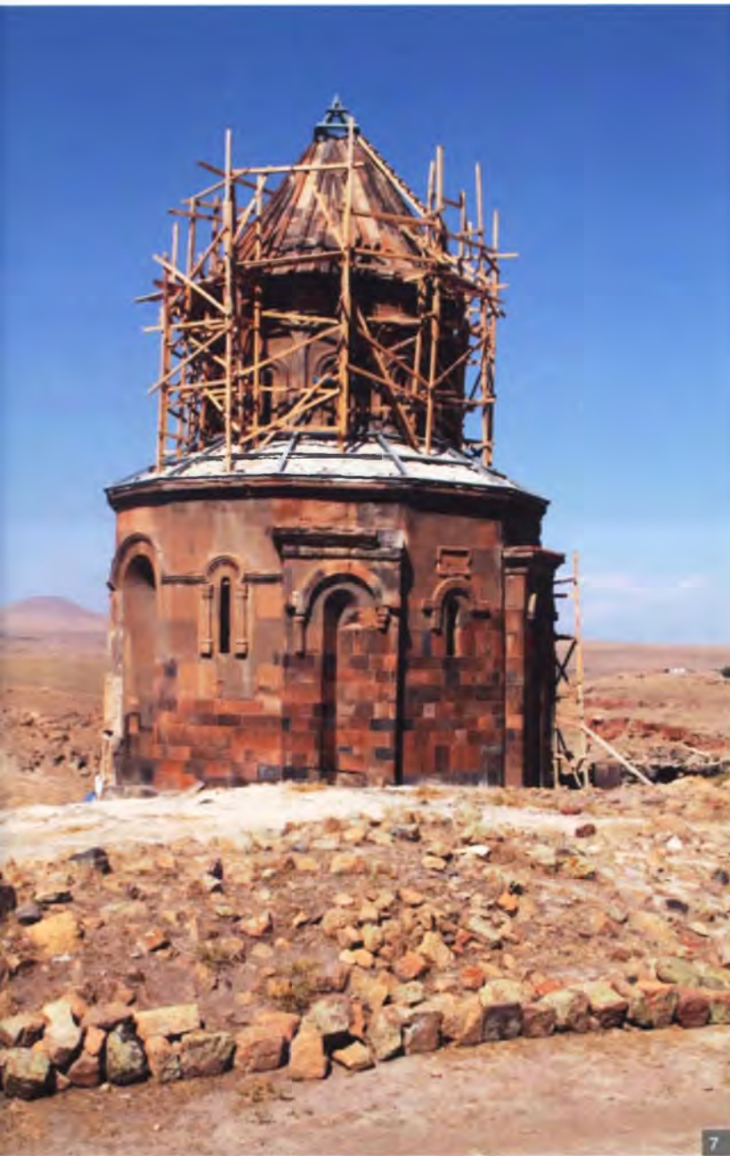
Мал. 7. Храм Св. Грыгора. Ані (X ст.)