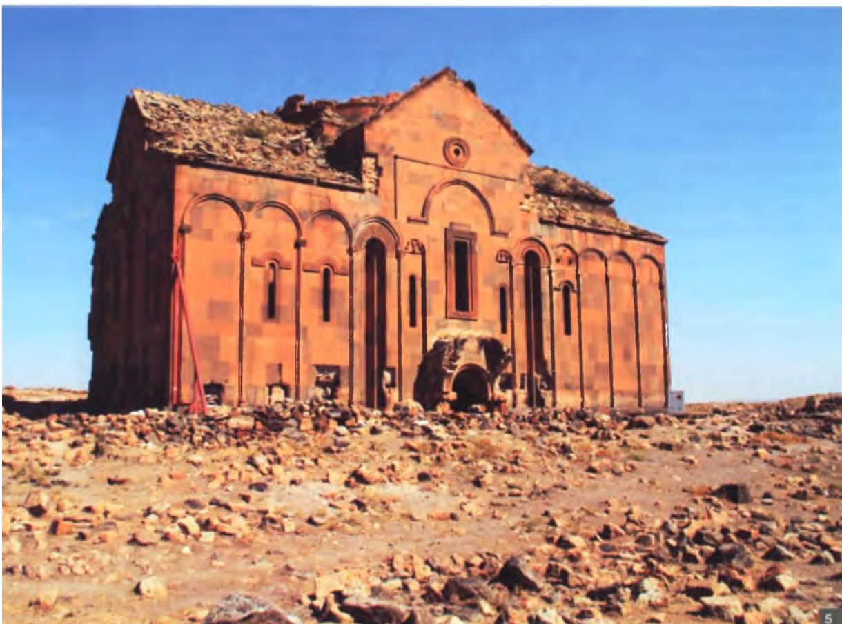
Мал. 5. Кафедральны сабор у Ані (X ст.). Агульны выгляд

І калі бачыш цудоўны кафедральны сабор у Ані (X ст.) з яго сціплым лаканічным аб'ёмам і сапраўды манументальным, гатычным інтэр'ерам (мал. 5, 6), разумееш, што у іх навуковых працах ёсць шмат ісціны. Скупасць формы у экстэр'еры быццам маскіруе цуд архітэктурнай прасторы, якая адкрываецца кожнаму унутры будынка.