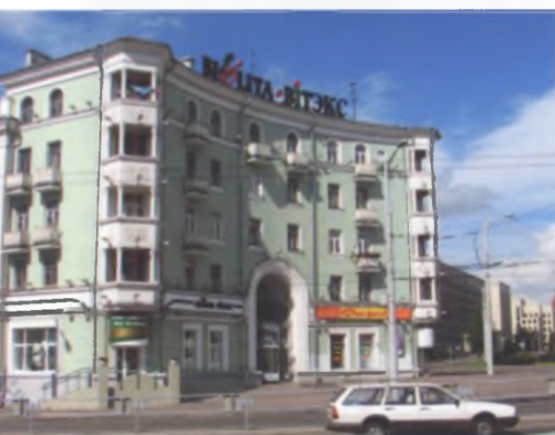
Жилой дом по ул. Мясникова в Минске