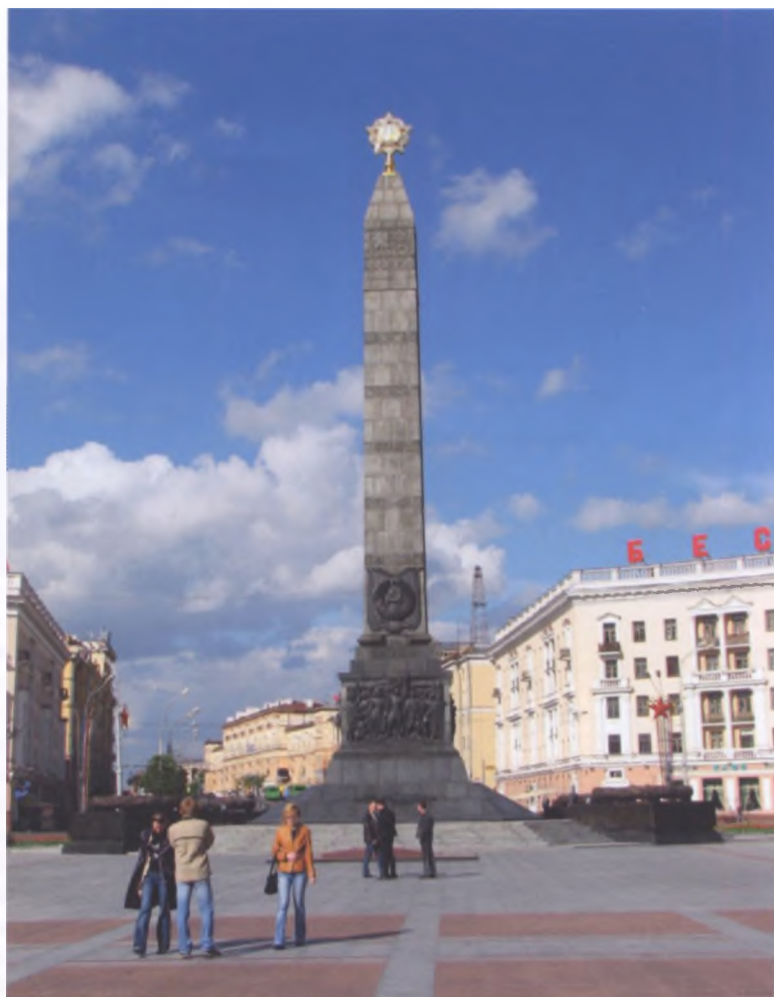
Монумент Победы в Минске

Во имя этой цели он пытался моделировать свою систему с использованием традиций национального искусства, что, по его глубокому убеждению, должно было привести к возрождению особенностей белорусской архитектуры. Примера-