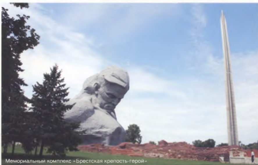
Мемориальный комплекс «Брестская крепость-герой»

Здесь будет уместно напомнить об опыте первых двух послевоенных десятилетий, когда проекты будущих общественных зданий, еще по традиции 1930-х гг., выставлялись в витринах магазинов. Они активно обсуждались в периодической печати. По этой причине перед создателями «каменной летописи» ставилась сверхзадача ответственного отношения к своему творчеству, которое должно отвечать запросам общества, духу времени, духу своей эпохи. В тот период ощущалась связь отдельной личности с судьбой возрождающегося города. Практически каждый житель Минска считал себя участником созидательного процесса по обновлению белорусской столицы. Писатель И. Шамякин прекрасно отразил величие этого архитектурно-строительного процесса в романе «Атланты и кариакиды», сравнив его с искусством по преимуществу общенародным.