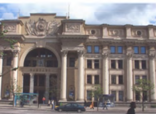
Здание главпочтамта в Минске