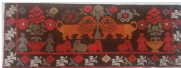
Рисунок 3. – Анонимный мастер. Тканый ковер

Узнаваем образ купальских трав и на тканом ковре анонимного автора из д. Доросино Любанского р-на Минской области (1930-е гг., льняные, шерстяные и хлопчатобумажные нити, односторонний перебор. 168x70). Симметричное изображение растений, состоящим из трех стеблей с цветами на концах отличаются лишь цветом ваз, в которые их поместил мастер, и окружающих их женских фигурок (рис. 3). При воплощении образа купальских трав, автор использовал зеленый цвет для стебля и оттенки красного для самих цветов. Следует обратить