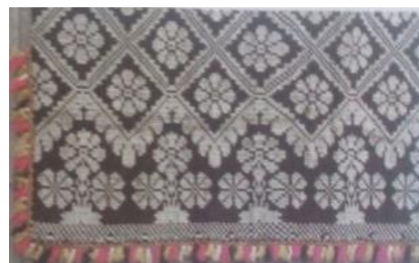
Рисунок 1. – З. Костюкович. Постилка

Образ купальских трав в виде трех цветов присутствует на постилке З. Костюкович из д. Ярцевка Борисовского р-на (1950-е гг. лен, хлопок, двухсторонний перебор) (рис. 1). Мастер использовал при создании своего произведения яркий колористический контраст. Благодаря этому белые цветы на темном фоне смотрятся более выразительно, приобретая определенный объем.