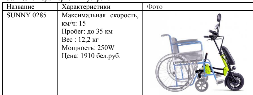
Таблица 1. Характеристики устройств

Поэтому, цель данной работы: разработать конструкцию, лишенную этих недостатков и полностью удовлетворяющую требования пользователей стран СНГ.