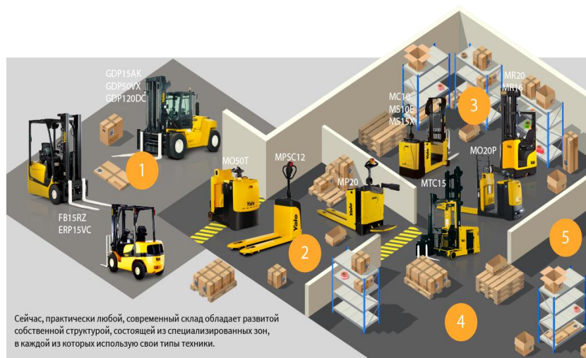
Рисунок 3 – Вариант использования складского оборудования