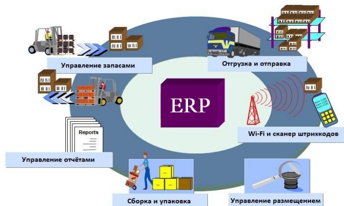
Рисунок 2 – Возможности ERP-системы

контролировать все вручную, надо быть волшебником, терминатором или другим вымышленным персонажем. Физически это невозможно, и здесь на помощь приходят ERP-системы (Enterprise Resource Planning System – Система планирования ресурсов предприятия). Эта корпоративная информационная система, предназначена для автоматизации учёта и управления. Она строится по модульному принципу, и более или менее охватывает все значимые процессы, происходящие в компании (рисунок 2).