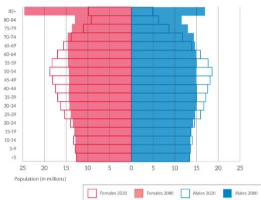
Рисунок 2- Прогноз возрастной структуры в ЕС в 2020 и 2080 годах

Европа стремительно стареет, что обусловлено значительным увеличением ожидаемой продолжительности жизни и снижением уровня рождаемости.