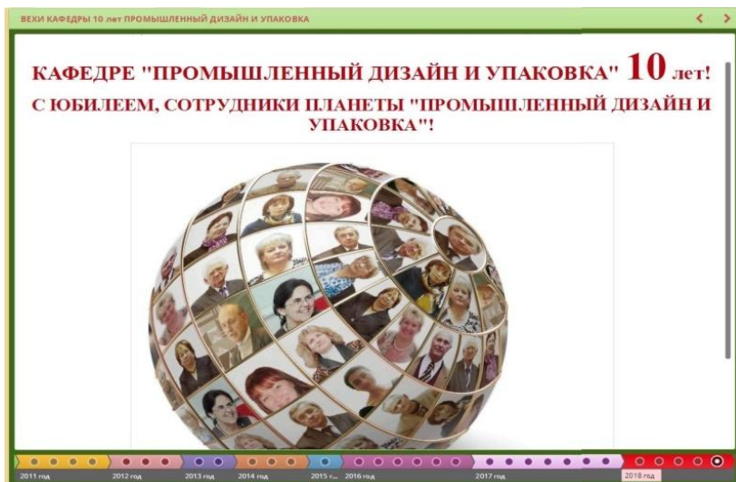
Рисунок 3. Временная шкала «Вехи кафедры»

Достоинствами ленты времени по сравнению с традиционными форматами работы: