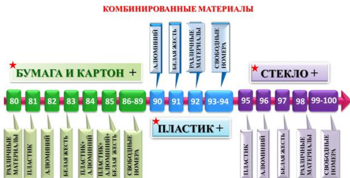
Рисунок 1 – Цифровое, буквенное (аббревиатура) обозначение материала, из которого изготавливается упаковка

«Лента времени» – это временная шкала, на которую в хронологической последовательности наносятся события. Чаще всего лента времени представляет собой горизонтальную линию с разметкой по годам (или периодам) с указанием последовательности событий. Современные информационные технологии позволяют включать в ленту времени не только текст, но и изображения, видео и звук (рис.1).