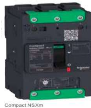
Рисунок 1. Внешний вид автоматического выключателя Compact NSX

Новое поколение автоматов производства Schneider Electric с термомагнитными расцепителями МА, ТМ или с полупроводниковыми расцепителями Micrologic защищают от токов перегрузки и КЗ распределительных сетей и, электрооборудования и протяженных линий.