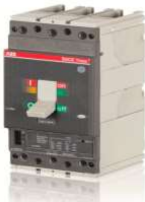
Рисунок 3. Внешний вид автоматического выключателя Tmax T

Это также автоматические выключатели в литых корпусах. Возможности их применения практически неограниченно благодаря разным специальным исполнениям, современной электронике, а также полному и унифицированному ассортименту аксессуаров