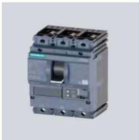
Рисунок 3. Внешний вид автоматического выключателя SENTRON VA

Серия автоматических выключателей Sentron VA от Siemens представляет собой трехфазные токоограничивающие автоматические выключатели. Серия Sentron VA имеет компактные размеры, что позволяет ей идеально подходить для использования в щитах распределения нагрузки.