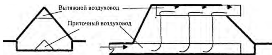
Рис. 1. Схема системы вентиляции буртов и траншей

Проектирование системы вентиляции буртов (рис. 1) связано с проведением ряда инженерных расчетов, основу которых составляет определение аэродинамического сопротивления слоя хранимой продукции. Методика таких расчетов в нормативной и научной литературе не обнаружена.