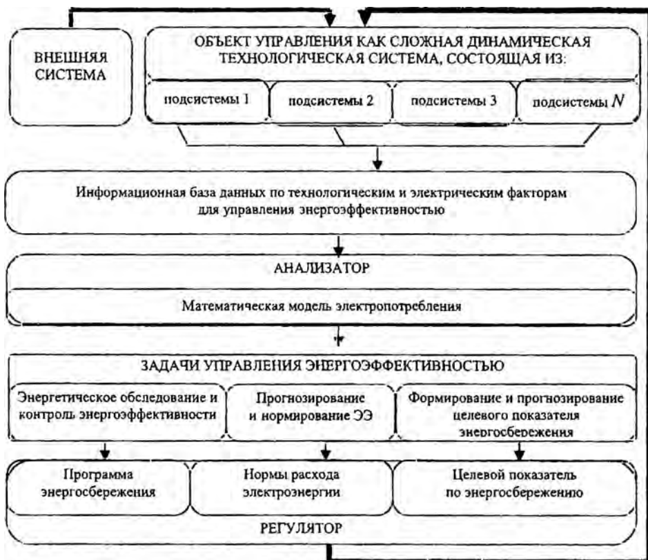
Рис. 1. Структурная схема управления ЭЭФ

Разработан комплексный подход к решению задач управления ЭЭФ для сложных технологических комплексов, который может быть представлен в виде структурной схемы (рис. 1).