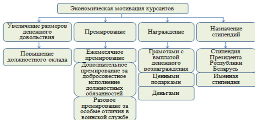
Рис. 1. Инструменты экономической мотивации курсантов

Стимулирование познавательной активности курсантов военных учебных заведений, выработка у них потребности в достижении высоких результатов обучения, осуществляется различными способами, в том числе, способами экономической мотивации.