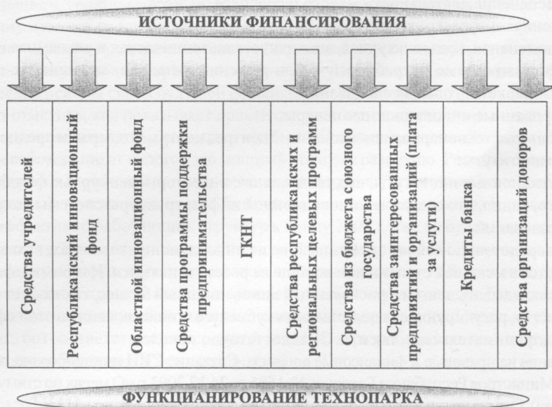
Рис. 1. Финансовое обеспечение субъектов инновационной инфраструктуры

В соответствии с международной практикой для полной самоокупаемости технопарка необходим период примерно в пять лет (рис. 2). Поэтому первый год функционирования СИИ нуждается в 100% финансировании своей деятельности.