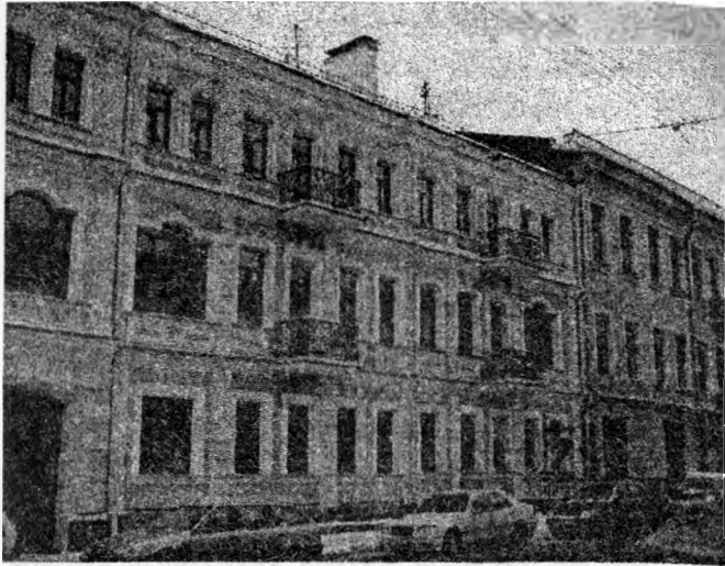
Рисунок 2 – Бывший доходный дом в г. Минске по улице Володарского 9 (современный вид)

вестировать средства в строительство многоквартирных домов (рис. 2).