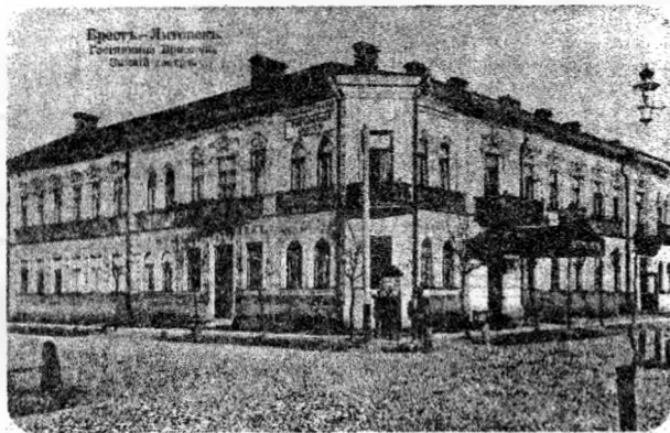
Рисунок 4 – Бывшая гостиница «Бристоль» в г. Бресте

Новый этап в развитии получили гостиницы, как самостоятельный тип жилья, предназначенный для временного пребывания (рис. 4). Располагались они в районах близких к железной дороге, на улицах, прилегающих к вокзалам, на центральных площадях.