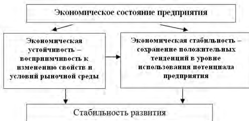
Рис. 1. Элементы, характеризующие экономическое состояние предприятия

Стабильность может быть рассмотрена относительно статичных и динамичных систем. Применительно к статичным системам, стабильность трактуется в аспекте категорий «покой», «равновесие», к динамичным – рассматривается как сохранение развития этих систем. В этом случае на уровне предприятия более правомерно использовать термин стабильность развития. Стабильность развития – комплексная характеристика состояния предприятия, отражающая его способность поддерживать неснижающийся уровень потенциала в условиях изменяющейся внешней и внутренней среды. Это стабильность тенденций развития.