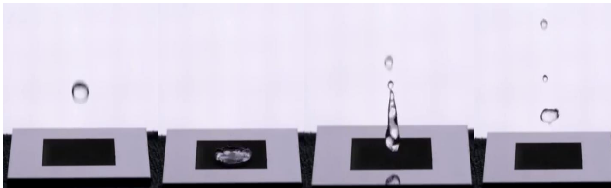
Рисунок 1 – отскок воды от материала

Учёные Американского университета Рочестер смогли создать металл, который настолько гидрофобен, что вода, падающая с высоты на его поверхность- отскакивает. (Рис. 1).