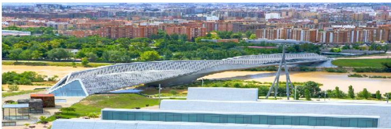
Рисунок 1 – Главный вид моста павильон

Мост-павильон – это современное уникальное здание, построенное в Сарагосе по проекту британско - иракского архитектора Захи Хадид. Она первой из представительниц прекрасного пола получила Притцкеровскую премию, создала свой собственный стиль и считается одним из самых талантливых и успешных архитекторов современности. Строительство началось в 2005 году и было завершено к июню 2008 года (Рис. 1).