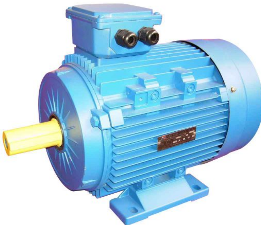
Рисунок 1 – Асинхронный генератор

При вращении приводного вала под воздействием внешнего механического импульса (от двигателя внутреннего сгорания, например) за счёт остаточного магнетизма статора в решётке такого ротора наводится собственная ЭДС. Вследствие этого оба поля (и подвижное, и неподвижное) начинают взаимодействовать друг с другом в динамическом режиме. Поскольку поле в обмотках ротора наводится с задержкой относительно неподвижного статора генератора, он несколько отстаёт от наводимого в ней э/м поля (то есть вращается асинхронно).