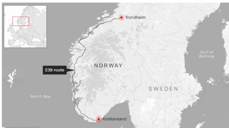
Рисунок 1 – Автомагистраль E39

Норвегия – прекрасная страна с высокими горами, ледниками и глубокими фьордами. Пересеченная местность не делает путешествие легким. Более тысячи фьордов расположены на западном побережье скандинавской страны, где проживает 5,3 миллиона человек. Для того, чтобы совершить путешествие между южным городом Kristiansand и Trondheim на севере через западное побережье (Рис.1), которое составляет 1100 километров, например, в настоящее время требуется более 20-ти часов и 7 переправ на паромках.