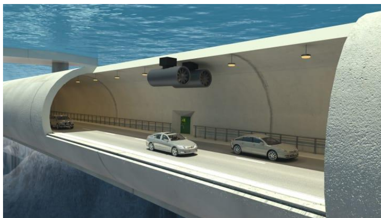
Рисунок 2 – Подводный плавучий тоннель

Путешествие между Kristiancand и Trondheim шоссе E39 является в настоящее время ключевым маршрутом для Норвегии.