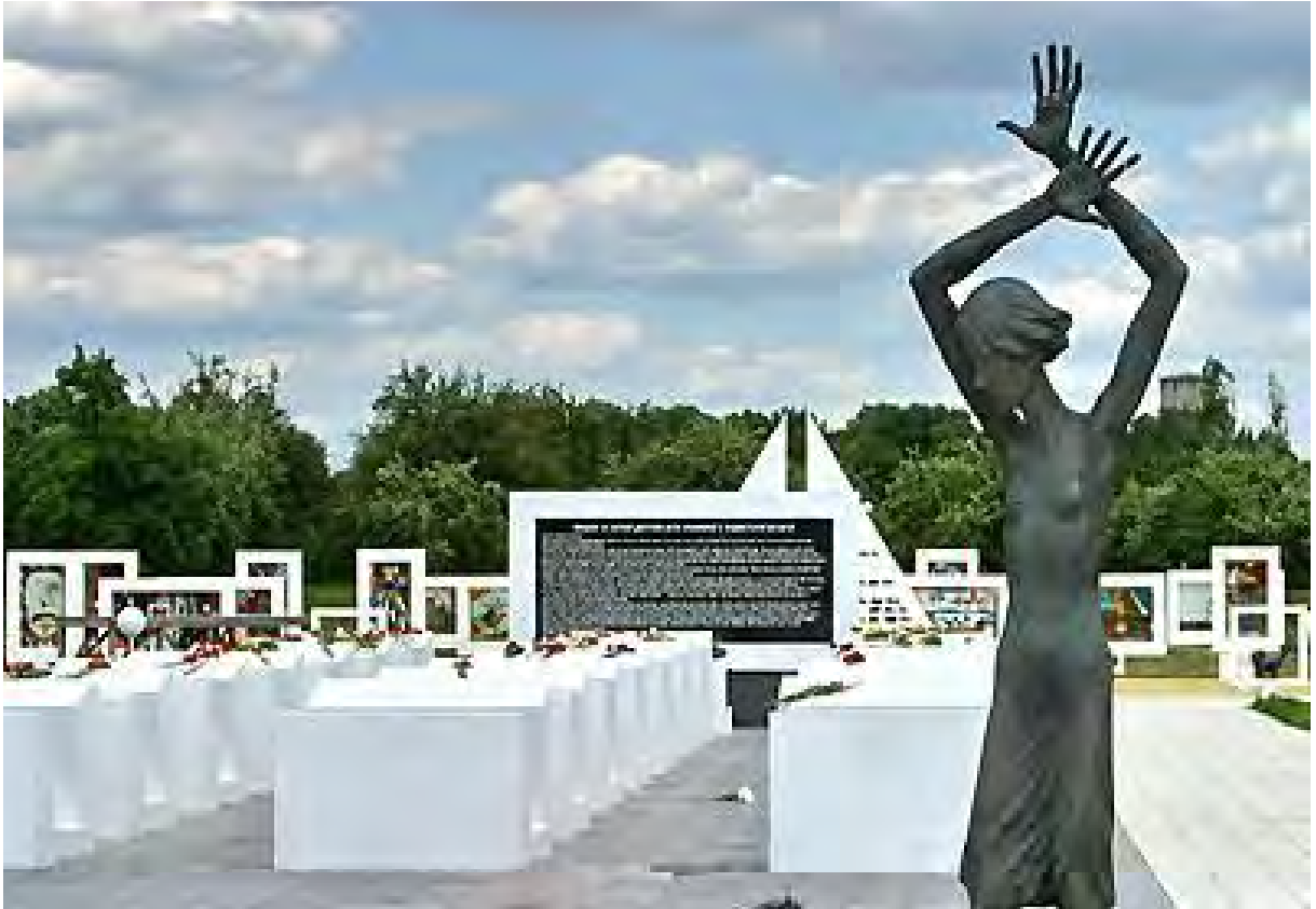
Мемориал «Детям – жертвам войны», 2007