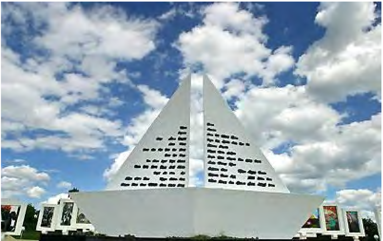
Мемориал – «белый парусник» – мечта детства