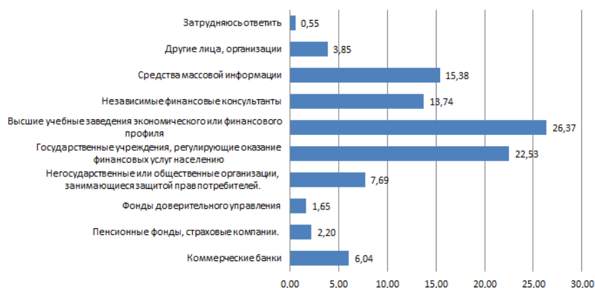
Рисунок 1 – Ответ на вопрос «Кто, по Вашему мнению, должен обучать граждан финансовой грамотности?»

Согласно Плану совместных действий государственных органов и участников финансового рынка по повышению финансовой грамотности населения Республики Беларусь, среди организаций, проводивших данные мероприятия, можно назвать следующие: Министерство образования Республики Беларусь, Национальный Банк, «Белорусская валютно-фондовая биржа», Ассоциация белорусских банков, ОО «БРСМ», Белорусская ассоциация страховщиков и другие. Ожидания опрошенных не были оправданы в полной мере: ВУЗы, ССУЗы, школы и СМИ не принимали активного участия в реализации Плана. Таким образом следует активно привлекать вышеперечисленные организации к проведению мероприятий по повышению финансовой грамотности.