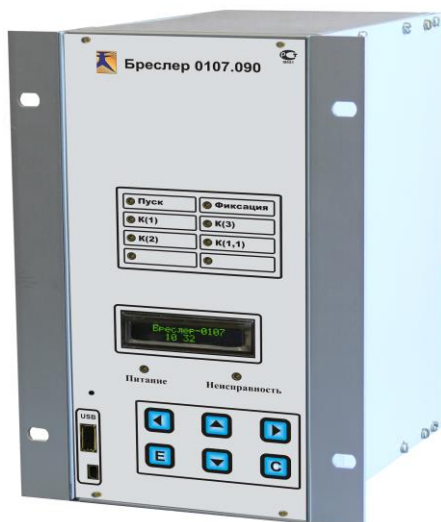
Рис. 1. Внешний вид терминала «Бреслер-0107.09»

Устройство фиксирует расстояние до места повреждения, вид замыкания, дату и время возникновения аварии. Пуск устройства возможен по встроенным пусковым органам, которые контролируют текущие токи и напряжения, а также их симметричные составляющие. Наблюдаемыми величинами являются симметричные составляющие прямой, обратной, нулевой последовательностей, а также их аварийные составляющие.