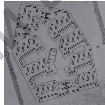
Рисунок 5 – Проект жилого микрорайона в Могилеве