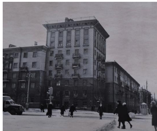
Рисунок 6 – Комплекс жилых домов полиграфкомбината