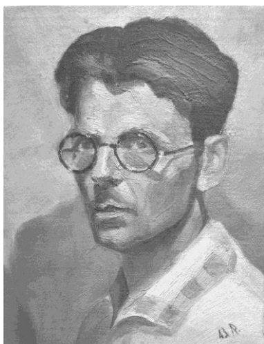
Рисунок 2 – Портрет отца

программы. Они же были инициаторами открытия выставки художников в Абези.