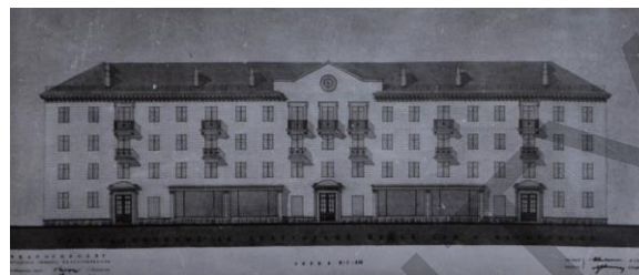
Рисунок 8 – Проект жилого дома серии №1-414 (2)

Янке Купале на родине в Радошковичах, поэту Якубу Коласу на московском кладбище.