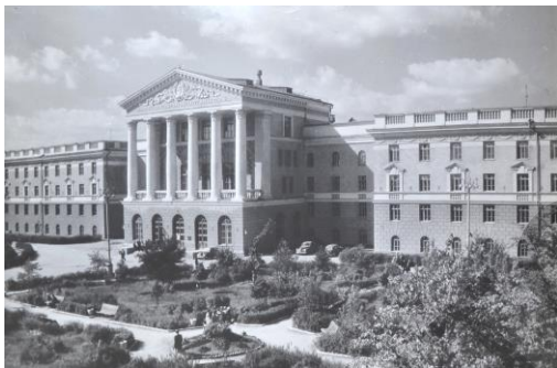
Рисунок 4 – Белорусский политехнический институт 1947 г.

Проект Л. Рыминского был великолепно исполнен, главный корпус института – монументальное четырехэтажное здание – украшено большим порталом, решенным в классическом ордере. Это придало всему ансамблю архитектурную выразительность и законченность.