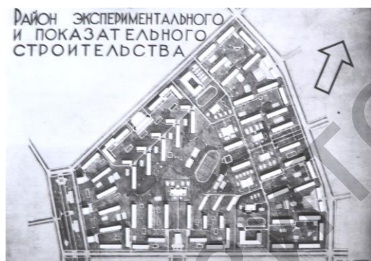
Рисунок 7 – Проект микрорайона по улице Волгоградской в Минске