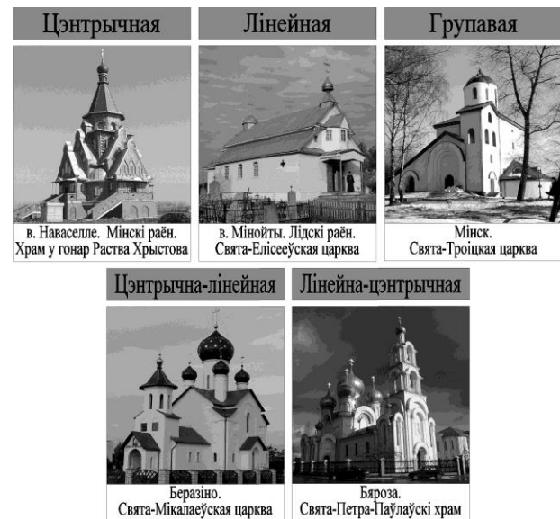
Малюнак 3 – Варыянты кампазіцый

і раўнавага, пірамідальнасць (в. Наваселле. Мінскі раён. Храм у гонар Раства Хрыстова); 2) спалучаюцца 2 гарызантальных і 5 вертыкальных восяў, параўнальна з 1 варыянтам, кампазіцыя атрымлівае больш складаную пабудову і характарызуецца прасторавасцю, іерархічнасцю аб’ёмаў. Выкарыстоўваюцца як дынамічныя, так і статычныя рашэнні (п. Краснасельскі. Ваўкавыскі раён. Свята-Георгіеўскі храм); 3) аб’ядноўвае 4 гарызантальных і 5 вертыкальных восяў. Па асноўным якасцям супадае з 2 варыянтам з той розніцай, што ў асноўным ужываецца статычная кампазіцыя (Мінск. Храм у гонар абраза Божай Маці “Мінскі”).