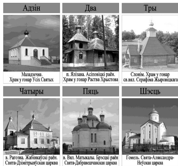
Малюнак 4 – Колькасць аб’ёмных элементаў

гарызантальных і вертыкальных вояў, аб’ёмаў. Для дадзенай кампазіцыі характэрны дынаміка і кантрастныя адносіны паміж элементамі, у тым ліку высотныя. У сувязі з адсутнасцю відавочнага строю і сістэмнасці, складанасцю з’яўляецца стварэнне гарманічнай, ураўнаважанай кампазіцыі, неабходнай пры ўзвядзенні праваслаўных храмаў, што абумоўлівае яе рэдкае выкарыстанне ў сучаснай практыцы. Нягледзячы на гэта, пры прафесійным рашэнні семантычных і кампазіцыйных задач могуць стварацца арыгінальныя вобразныя рашэнні (Мінск. Свята-Троіцкая царква).