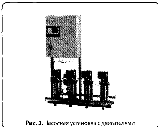
Рис. 3. Насосная установка с двигателями с водяным охлаждением

К тому же приняты изменения в действующие нормы проектирования внутреннего водопровода зданий, которые допускают размещение как водопроводных насосов, так и канализационных насосных установок в зданиях при обеспечении требуемых ограничений по шуму и вибрации.