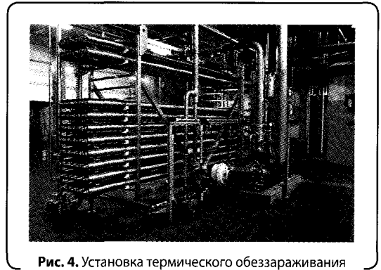
Рис. 4. Установка термического обеззараживания сточных вод

Приемлемым техническим решением в данном случае могут быть сооружения биологической очистки заводского изготовления. Конструктивные особенности таких установок определяются степенью очистки и тем, какая форма микроорганизмов используется: активный ил или прикрепленные формы (биопленка). Такие установки могут быть открытого (в виде открытых емкостей, монтируемых в зданиях или вне их) и закрытого (в виде закрытых емкостей, размещаемых в грунте, реже в зданиях) типов.