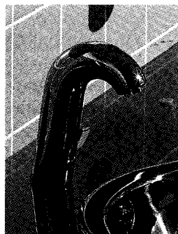
Рис. 1. Бесконтактные смесители с сенсорным управлением

Кроме того, ряд специфических положений, непосредственно относящихся к оснащению и функционированию санитарно-технических систем зданий ЛПО, выделен в отдельный ТКП 45-4.02-87 «Здания и помещения лечебно-профилактических организаций. Санитарно-технические системы. Правила проектирования». Указанный документ содержит данные по определению объемов водопотребления и водоотведения, проектированию лечебных бассейнов и связанных с ними систем водоподготовки, подключению кафедр водолечения к водопроводу, размещению трубопроводов и санитарных приборов, отведению и очистке сточных вод. Как известно, режим использования внутреннего водопровода в зданиях ЛПО в ряде случаев требует применения особых конструкций запорно-регулирующей арматуры и санитарных приборов, например водоразборных приборов с педальным или локтевым приводом, термостатических смесителей. Учитывая, что к настоящему времени стали доступными бесконтактные сенсорные санитарные приборы (рис. 1), их применение может быть более рациональным по сравнению с конструкциями с механическим приводом (рис. 2). Использование оборудования для водолечения по большей мере не вызывает проблем технического характера ввиду достаточно большого разнообразия такого рода продукции и наличия ТНПА, регламентирующих ее применение.