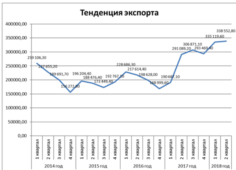
Рисунок 1 – Динамика экспорта из Республики Беларусь в Республику Польша за 2014-2018 годы

Сумма экспорта из Республики Беларусь в Республику Польша в 1 квартале 2014 году была равна 259 106,3 долларов США. На последний квартал исследуемого периода приходится наибольший подъем экспорта, который составил 338 552,8 долларов США, что на 30,66% больше по сравнению с базовым периодом. Наименьшего значения экспорт достиг в 4 квартале 2014 года и составил 156272,8 долларов США, что на 39,69% меньше по сравнению с 1 кварталом того же года. За анализируемый период не наблюдалась какая-либо стойкая динамика уменьшения/увеличения экспорта (Рисунок 1).