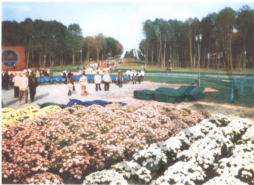
Композиционная ось развивающегося общегородского центра Лиды получила продолжение за р. Лидейку

Так случилось, что в XX в. Лида развивалась в основном в южном и западном направлениях. Поэтому сформировавшаяся в 1950-х гг. на месте старинного торгового центрального городской площади (архит. В.Г. Исаченко, Военпроект) с Домом офицеров, горкомом КПБ и кинотеатром оказалась вблизи восточной границы городской территории. В связи со строительством новых зданий кинотеатра и универсама на перекрестке улиц Победы и Ленинской городской центр как бы сделал попытку переместиться в западном направлении, однако последовавшее размещение здания райисполкома позади здания горкома КПБ опять развернуло городское ядро к востоку, к долине Лидейки. Еще через десятилетие был сделан правильный выбор участка для строительства районного Дома культуры (архит. В.Г. Исаченко). Здание разместилось восточнее райисполкома, развернувшись главным фасадом к ул. Ленинской, но значительно отодвинувшись от дороги, как будто предоставляя возможность в перспективе развивать планировочную ось далее к реке. Так и произошло: принятое в ходе реконструкции 2010 г. проектное решение создать на продолжении этой оси открытый амфитеатр со сценической площадкой (архит. А.Б. Захарчук, Гродногражданпроект) было подсказано ситуацией.