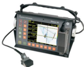
Рис. 1. Внешний вид ультразвукового дефектоскопа Phasor XS

Ультразвуковая дефектоскопия сварных соединений, обладает высокой чувствительностью к дефектам типа трещин и непроваров, большой производительностью, возможностью производить контроль непосредственно на рабочих местах без нарушения технологического процесса, низкой стоимостью контроля. В качестве технического средства для проведения контроля выбран ультразвуковой дефектоскоп Phasor XS (рис. 1).