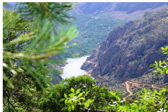
Рис. 4. Ландшафт заповедника у села Рамит