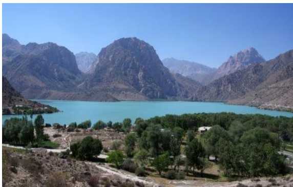
Рис. 1. Высокогорное озеро Искандеркуль

Для сохранения существующего фонда застройки следует начать реконструкцию горных сел с учетом достижений научно-технического прогресса в области градостроительства горного региона. Особое внимание необходимо обратить на сохранение, использование и включение в композиции поселков памятников архитектуры, истории и культуры в гармонии с горным ландшафтом.