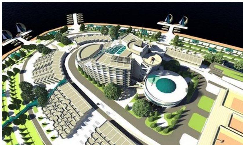
Рис. 6. Экспериментальная проектная разработка туристическо-развлекательного комплекса на берегу высокогорного озера Искандеркуль