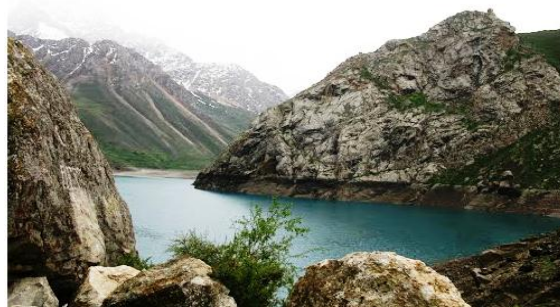
Рис. 2. Озеро Хафт Куль на Зеравшанских горах