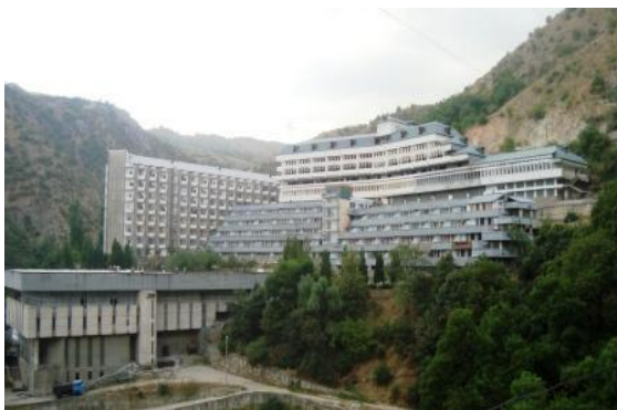
Рис. 3. Санаторий Ходжа-Обигарм в Варзобе