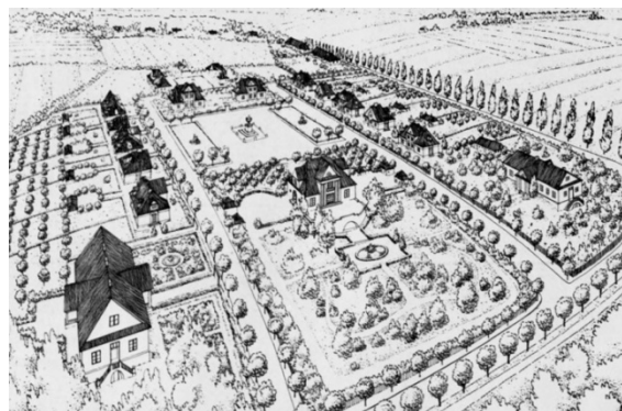
Мал. 7. Пасёллак ў Нясвіжы. Арх. Т. Буршэ, інж. Ю. Крупа. Від з птушынага палету. – Budowa domów dla urzędników państwowych w województwach wschodnich. – Warszawa, 1925. – с. 47

хто застаўся, не моцна дбалі пра сваё акружэнне.