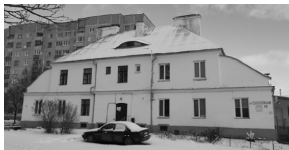
Мал. 3. Чатырохкватэрны дом у Слоніме. Арх. В. Хэннеберг. Агульны выгляд.

аднолькавых кватэр. Дамы мелі два асобныя ўваходы, над якімі часам рабіліся два сіметрычныя мезаніны. У некаторых дамах, каб стварыць такі сілуэт, архітэктары будавалі дадатковы цэнтральны мезанін. Тут маглі размяшчацца гаспадарчыя памяшканні, пакоі для гасцей ці для прыслугі. Даволі цікавы прыклад кампануюкі дэманструе двухпавярховы дом архітэктара В. Хэннеберга на чатыры кватэры, размешчаны ў Слоніме (мал. 3).