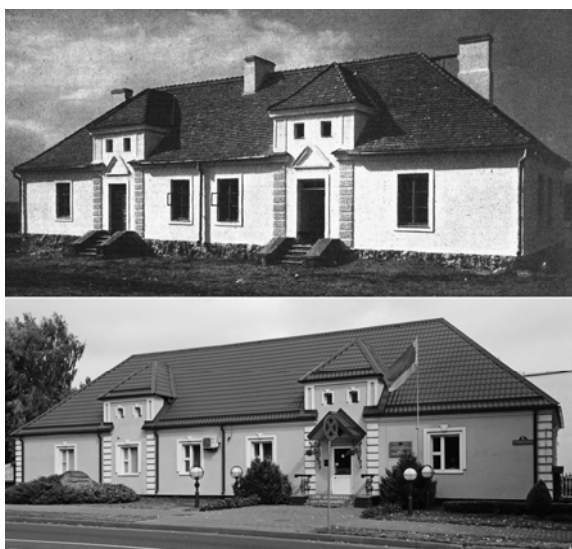
Мал. 6. Двухкватэрны дом у Стоўбцах і Лідзе. Арх. З. Тарасін. Агульны выгляд.

3. Тарасіна, два з якіх добра захаваліся да нашых дзён у Стоўбцах. Вокны і дзверы тут аформлены простымі прамавугольнымі ліштвамі, але над дзвярамі размешчаны ляпны разарваны франтон – элемент архітэктуры барока. Ён не моцна ўдаражыў пабудову, а наколькі трапна быў выкарыстаны, мы можам дазнацца толькі зірнуўшы на аналагічны дом у Лідзе, дзе пры апошнім рамонце гэтыя элементы згубленыя (мал. 6). Сённяшнія архітэктары відавочна спрабавалі кампенсаваць страту: дадалі яшчэ адну паліцу ліштвам і аздобілі іх замкавым каменем, але першапачатковую гармонію паўтарыць у іх не атрымалася.