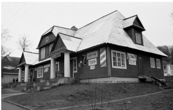
Мал. 4. Двухкватэрны дом у Навагрудку. Арх. В. Хэннеберг. Агульны выгляд.

Да нязменных элементаў можна аднесці выкарыстанне фігурных калон для афармлення ўваходаў. Калоны вышыней у два паверхі ствараюць фасады трох ацалелых дамоў на адну сям'ю ў пасёлку для службоўцаў Навагрудка архітэктара В. Хэннеберга (мал. 4). Пастаўлены побач двухкватэрны дом Е. Мюлера ўпрыгожаны двума сіметрычнымі ганкамі больш сціпрых памераў. У гэтых драўляных пабудовах калоны добра намаляванага дарычнага ордэра складзеныя з цэглы і атынкаваныя. Выкананне такіх элементаў, безумоўна, патрабуе даволі высокай кваліфікацыі муляроў і штукатураў, але эфект яго відавочны: дамы па сённяшні дзень вызначаюцца сваім выглядам, а калоны патрабуюць хіба што час ад часу пабелу. Гэтыя элементы былі падгледжаныя аўтарамі ў архітэктуры палацаў, таму нездарма такі стыль называлі “дварковым”.