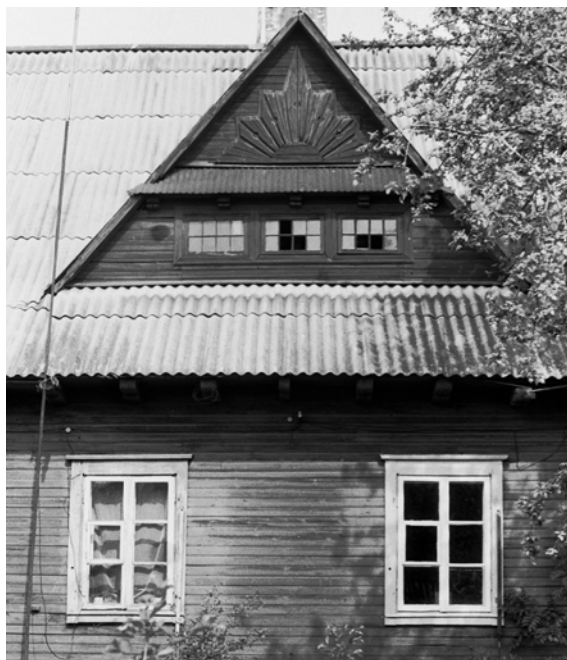
Мал. 5. Двухкватэрны дом у Глыбокім. Арх. праф. Ю. Клос. Агульны выгляд.

Ганкі, запраектаваныя ім ў дамах на дзве сям'і ў пасёлках Браслава, Глыбокага і Беразвечча, былі аздобленыя фігурнымі слупамі з падкосамі, прапільнымі агароджамі. На жаль, большасць з іх была ператворана ў веранды і згубіла першапачатковы выгляд. Знікаюць і арыгінальныя дэкаратыўныя ўпрыгожванні на франтонах у выглядзе сонечных промнеў (мал. 5), якія паўтараюць “закапанскі” стыль, прапагандаваны яшчэ перад вайной польскім мастаком і архітэктарам С. Віткевічам. Пры больш пільным даследаванні беларускай народнай архітэктуры становіцца відавочным, што такі дэкор быў шырока распаўсюджаны і тут, а стылізацыя пад дэкор з рэгіёна польскіх Татр толькі дадала моднага на той час каларыту.