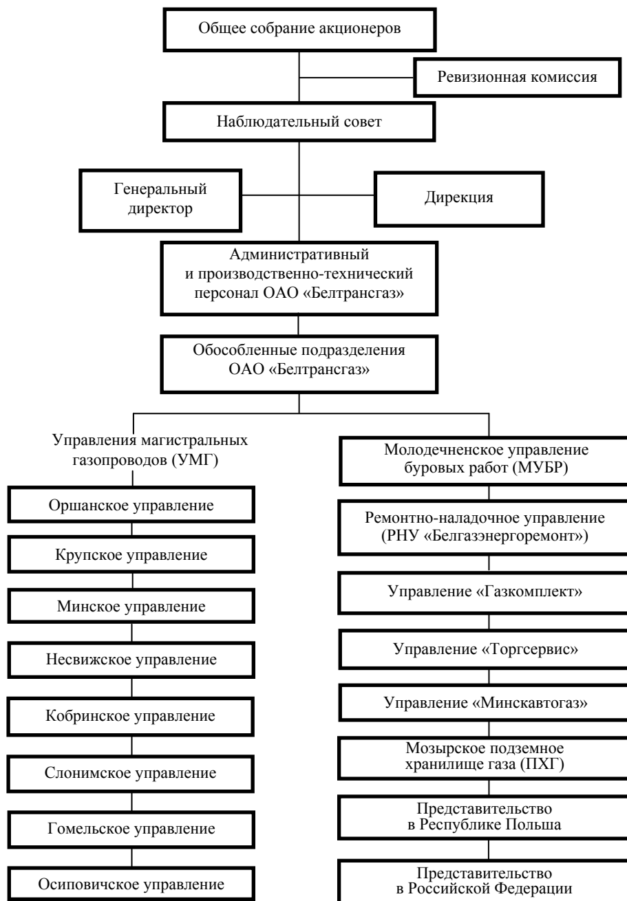
Рис. 1. Структура управления ОАО «Белтрансгаз»

ОАО «Белтрансгаз» – монополист по поставке природного газа в Республику Беларусь и транзиту его в соседние страны. Структура управления компанией показана на рис. 1.