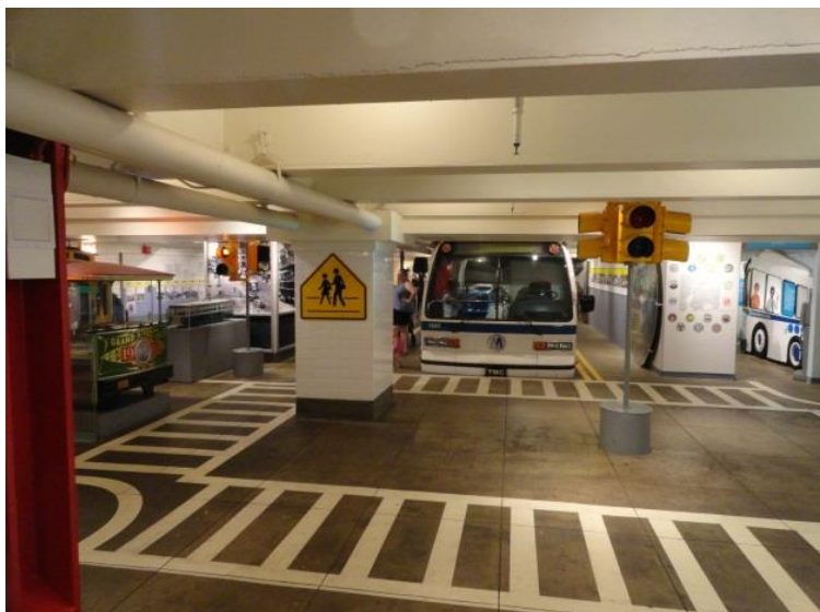
Рисунок 7 – Зал для детей