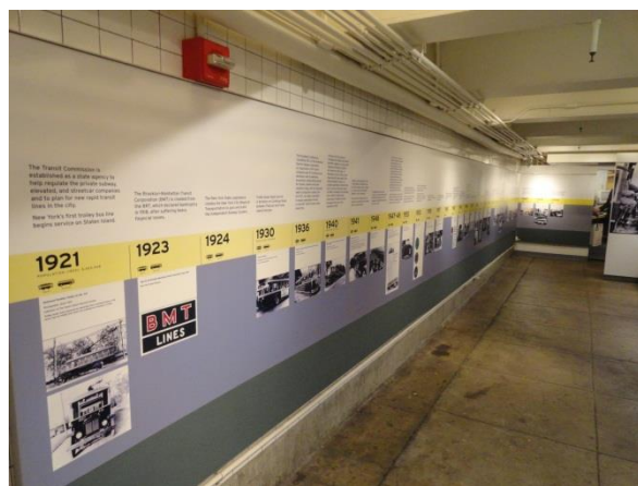
Рисунок 2 – Фрагмент стенда по истории развития городского транспорта Нью-Йорка

Далее расположен зал с моделями трамваев (включая конку), троллейбусов и автобусов всех эпох. Над ними висят стенды, на которых дается краткая транспортная хронология городского транспорта Нью-Йорка с фотографиями подвижного состава на улицах города, начиная с появления первого конного трамвая (1831 г.). Такой полной истории транспорта этого города невозможно найти ни в какой книге, а только в этом музее.