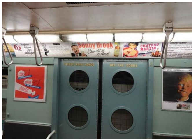
Рисунок 15 – Вагон метро 1940-х годов

Посещение этого музея – всегда праздник. Я побывал в этом музее 4 раза: в июне 2013 г., июне 2014 г., июне 2015 г. и июле 2016 г., приводя туда все новых и новых студентов-географов 2 курса,