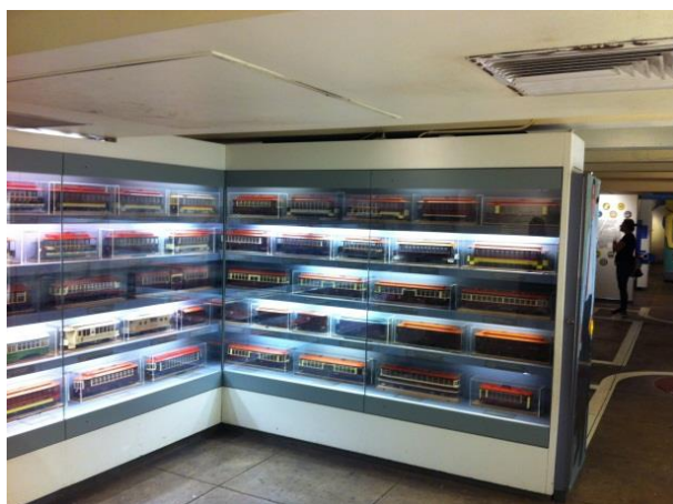
Рисунок 4 – Модели трамваев Нью-Йорка всех эпох