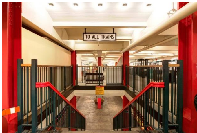
Рисунок 9 – Спуск на нижний ярус музея к поездам метро