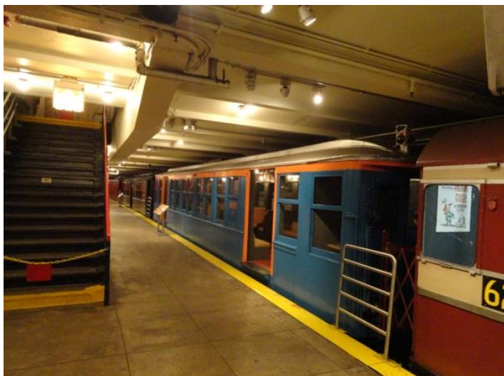
Рисунок 12 – Старые поезда метро