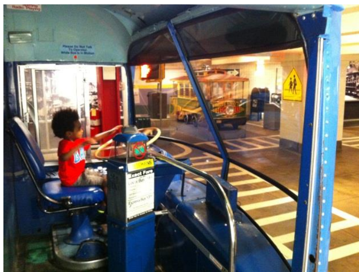
Рисунок 8 – Дети – главные посетители музея