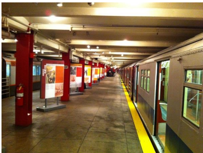
Рисунок 10 – Платформа станции метро со старыми вагонами метро

Посмотрев всё это, можно по лестнице спуститься вниз на платформу станции метро. Тут уже вы увидите только вагоны метрополитена всех эпох, в каждый из которых можно зайти и посидеть на