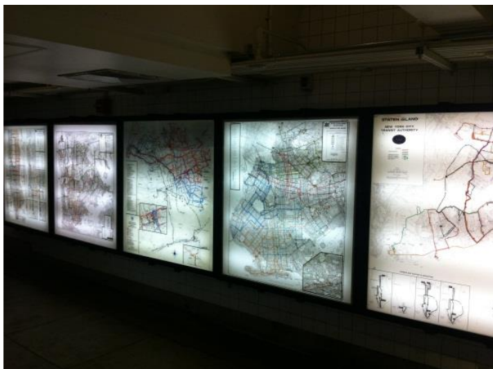
Рисунок 6 – Карты линий трамвая Манхэттене, Бронкса, Квинса, Стейтен-Айленда, Бруклина