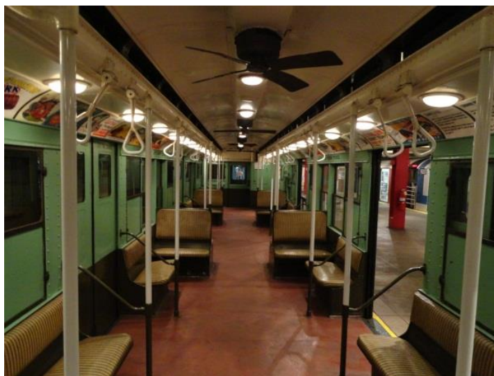
Рисунок 13 – Вагон метро 1920-х годов