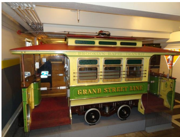
Рисунок 3 – Модель трамвайного вагона в Бруклине

Рядом стоят копии отдельных вагонов трамвая и автобуса по-крупнее; есть даже части настоящих автобусов с рулем, за которыми, конечно, сидят дети. Здесь же есть и альбомы большого формата с изображениями всех моделей трамваев, троллейбусов и автобусов Нью-Йорка; карты линий автобуса и трамвая.