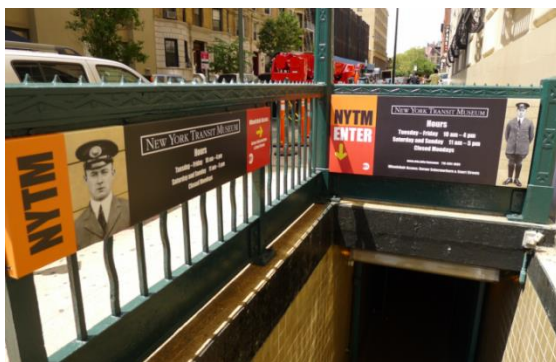
Рисунок 1 – Вход в музей

В центре Бруклина, на углу улиц Voerum Place и Schermerhorn Street, на закрытой в 1960-е годы станции метрополитена Court St расположен уникальный музей истории городского транспорта Нью-Йорка. Открыт он в 1976 г.