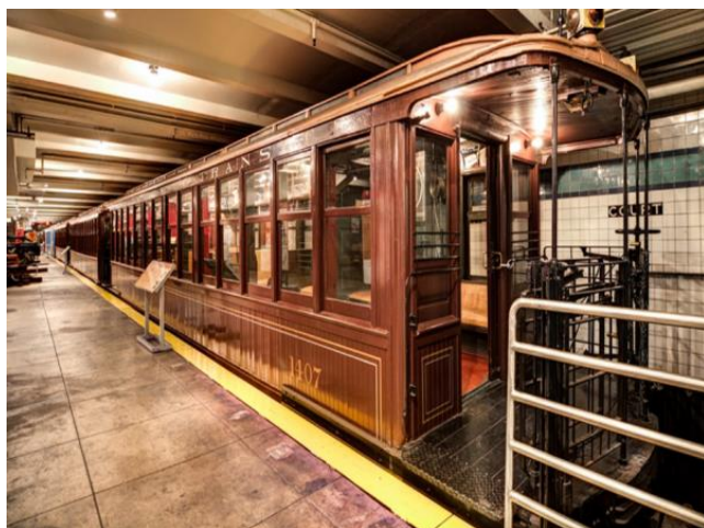
Рисунок 11 – Нижний ярус музея. Самый старый вагон метро 1900-х годов

В самом конце станции выставлены служебные и грузовые вагоны и локомотивы.