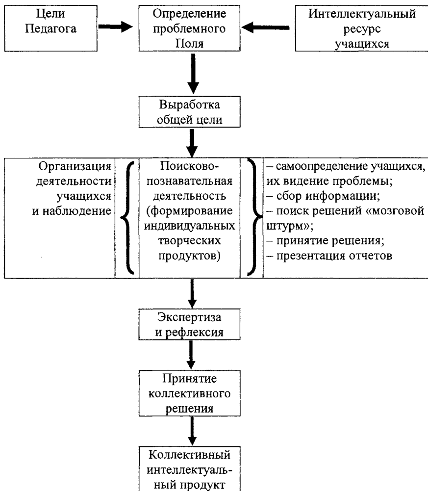
Рис. 2. Типовой контур управления в рамках инновационных методов воспитания

А.М. Матюшкиным выделены основные типы межличностного взаимодействия: