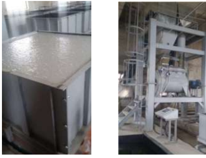
Рисунок 2 – Оборудование для производства теплоизоляционных материалов на основе вспененного жидкого

В качестве армирующих наполнителей матрицы из вспененного жидкого стекла исследованы волокнистые отходы природного и искусственного происхождения, а именно: опилки, отходы минераловатного производства, отходы переработки шин в виде текстильного шинного корда, верховой торф.