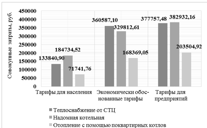
Рисунок 2 – Совокупные затраты по 36-квартирному дому, рублей

Таким образом, при оплате теплоснабжения по экономически обоснованным тарифам совокупные затраты выросли в 2 – 3,6 раза. А при тарифах для предприятий в 2,7 – 6,8 раза.