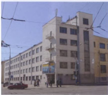
Дом печати в Минске