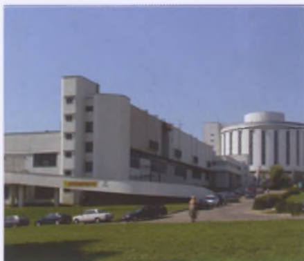
Комплекс предприятий по хранению и обслуживанию автомобилей в Минске