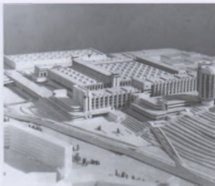
Проект завода промышленных роботов в Минске