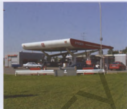
АЗС в Минске

риалом для него был железобетон, достаточно ограниченно применялся металл, что инициировало разработку оригинальных конструктивных решений по сочетанию металлических и железобетонных элементов. Однако в целом такое положение было вынужденным и обусловленным экономическими ограничениями. Отмечалось и определенное отставание по использованию в строительстве новых материалов на основе пластических масс.