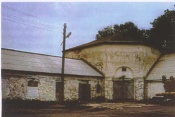
Чугунолитейный завод в Вишнево, Ошмянского уезда