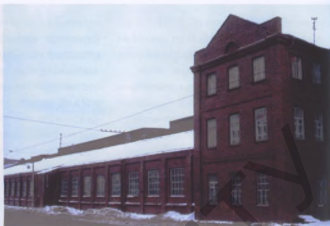
Металлообрабатывающий завод «Гигант» в Минске

на белорусских землях вплоть до середины XIX в. еще полным ходом шло мануфактурное строительство. Такое отставание было обусловлено историческими реалиями существования здесь крепостного права. Стеклопечные гуты Радзивиллов в Налибоках и Уречье, суконные мануфактуры Огинского и Новосильцева на Слонимщине не представляли промышленную архитектуру как новую область, но тем не менее уже отличались от аналогичных построек, возводившихся ранее в европейских странах. Отличие это заключалось прежде всего в том, что белорусские мануфактуры использовали элементы машинного производства и потому демонстрировали отдельные приемы фабрично-заводской архитектуры. Так, в суконных предприятиях Скимунта в имениях Хомск, Поречье, Альбертин, 1790–1798, внутреннее пространство организовывалось ярусно, по типу этажерки, что было характерно для настоящих промышленных зданий.