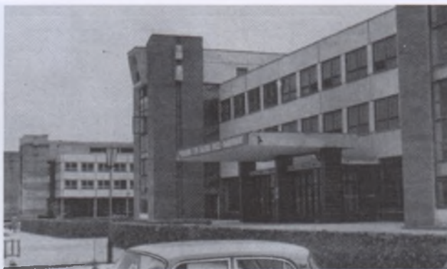
Предприятия Минлепищемаша в Бресте