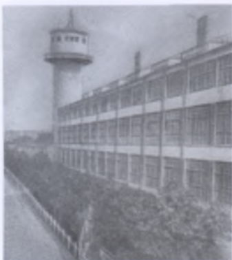
Чулочно-трикотажная фабрика «КИМ» в Витебске