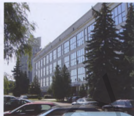
Часовой завод в Минске

типов — пролетное здание, здание с двухуровневым развитием пространства, объекты обслуживания рабочих, были достигнуты результаты, ставшие определенным вкладом в мировую практику.