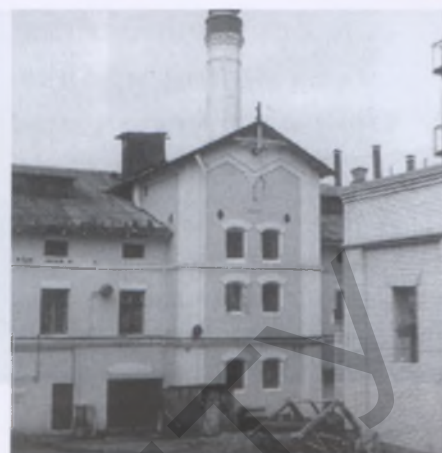
Пивоваренный завод в Гродно

США, был более распространен в Беларуси, чем в других областях Российской империи.