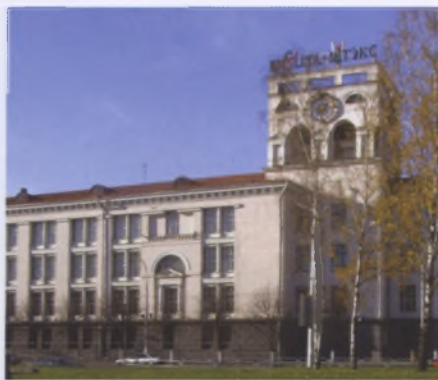
Комплекс предприятий на пл. Я. Коласа в Минске