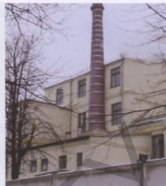
Хлебозавод в Минске

нах, но и во второй половине периода (1950–1980) сама принимала участие в их развитии.