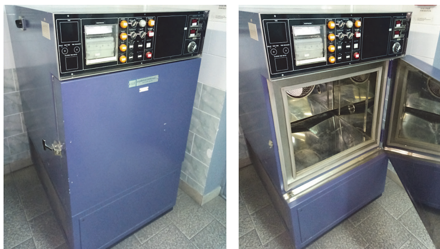
Рис. 2. Камера искусственного климата марки 2X-5655-CH

Атмосферная коррозия – коррозия металлов в условиях атмосферы, наблюдается под конденсационными видимыми слоями влаги на поверхности металла (мокрая атмосферная коррозия) или под тончайшими невидимыми адсорбционными слоями влаги (влажная атмосферная коррозия). Особенностью атмосферной коррозии является ее сильная зависимость скорости и механизма от толщины слоя влаги на поверхности металла или степени увлажнения образовавшихся продуктов коррозии.