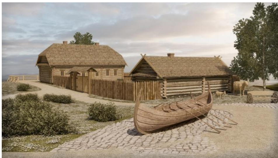
Рисунок 6 – Реконструкция усадьбы князей

Далее по маршруту следования располагается воссозданное на основе имеющихся исторических сведений имение Радзивиллов XVII века (Рис. 6). Имение представляет собой замкнутую территорию площадью 616 м 2 , что соответствует историческим данным. Внутри двора располагаются четыре отдельных строения: главный или гостинный дом, погреб, конюшня и кухонный дом. Учитываются приведенные сведения о планировке и конструктивных особенностях каждого здания, подробные описания устройства окон и дверей, заполнения оконных и дверных проемов. При воссоздании этих сооружений и их архитектурно-конструктивных решений предполагается максимальное использование традиционных решений народной архитектуры и старинных строительных технологий. Так, например, жилой дом выполнен из тёсаного бруса, а конюшня и кухонный дом – из брёвен. Внутреннее пространство двора имеет мощение для обеспечения комфортного пребывания туристов. Внутри построек будет открыта экспозиция, рассказывающая о быте того времени.