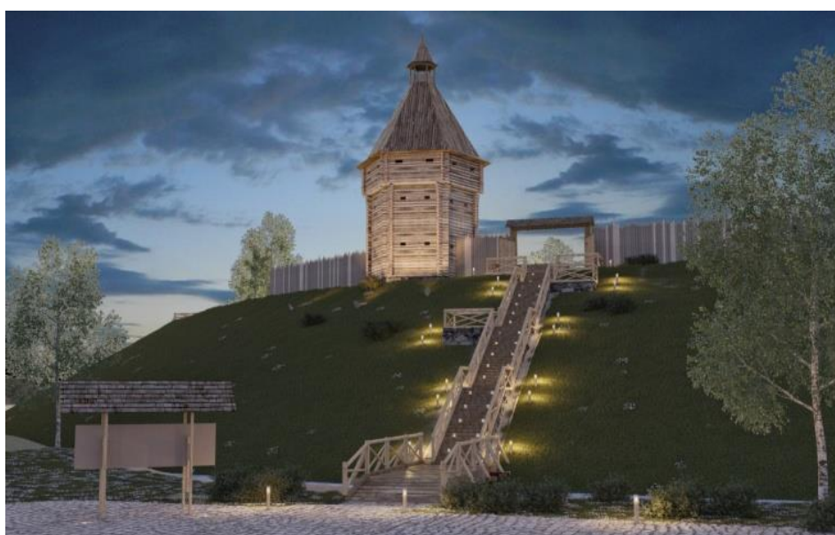
Рисунок 5 – Главный подъём на «Замковую гору»

С целью воссоздания исторической атмосферы главные объекты комплекса будут расположены на вершине Замковой горы. Будет построен подъём на городище, имеющий две выделенные площадки для отдыха и обзора территории (Рис. 5).