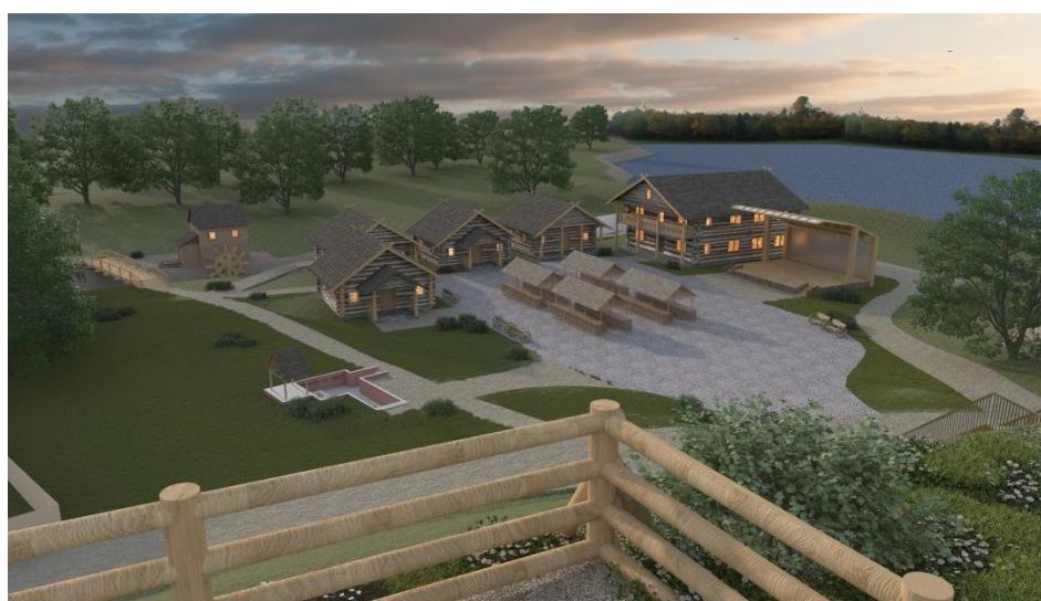
Рисунок 8 – Вид со смотровой площадки на «Город мастеров»

Основной спуск с городища осуществляется по другой лестнице, которая ведёт к источнику. В 2009 году источник был реконструирован и освящён. За водой из этого источника приходят жители других поселений, а также туристы. Поэтому было важно организовать и разработать территорию вокруг источника. Предлагается создать небольшой развлекательный комплекс под названием «Город мастеров», который будет также способствовать привлечению туристов, организации их досуга (Рис. 8). Основное пространство этой зоны сформировано открытой выставочной площадью. Здесь расположены торговые павильоны, где можно будет приобрести продукты народного творчества и сувенирную продукцию.