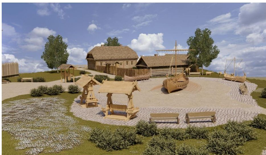
Рисунок 7 – Рекреационная площадка на «Замковой горе»

периоды. Также на горе располагаются развлекательная площадка и несколько экспозиций с деревянными скульптурами животными.