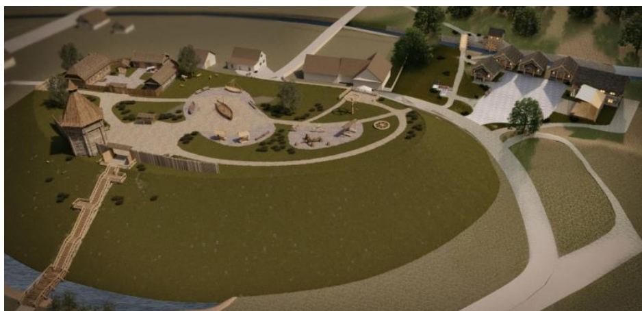
Рисунок 4 – Общий вид проектируемого комплекса

Копыле, Замковая гора обзревается из многих точек города. Всё это будет способствовать привлечению туристов (Рис. 4).