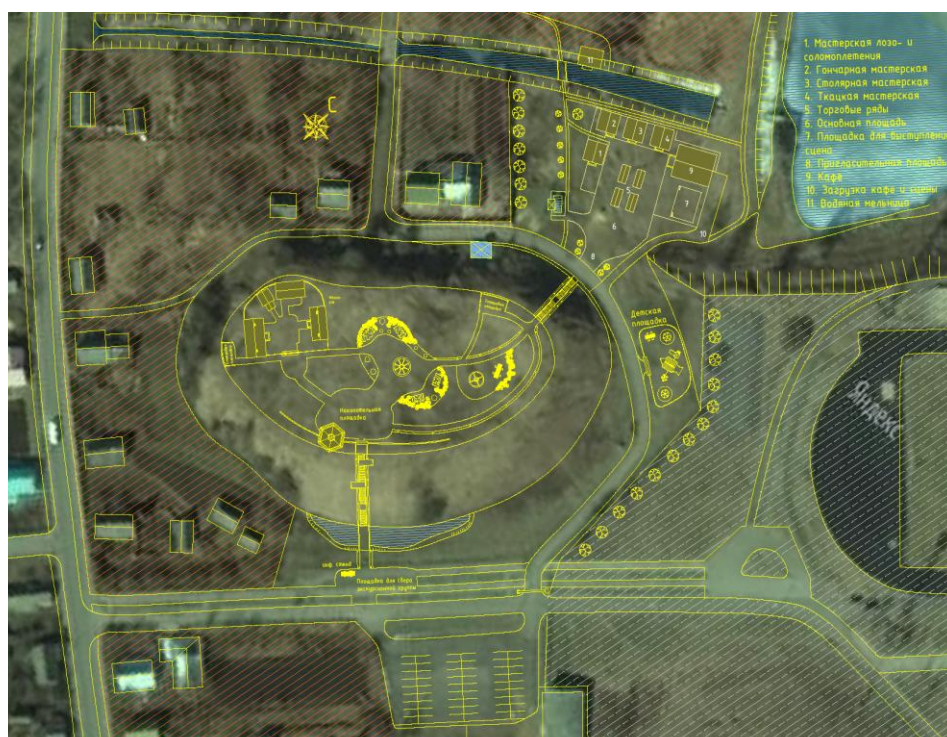
Рисунок 3 – План проектируемой территории

Принимая во внимание все приведенные данные, мы предлагаем создать в городе Копыле историко-культурный комплекс, который будет выполнять одновременно культурно-образовательные и развлекательные функции, тем самым способствуя развитию города и привлекая туристов (Рис. 3).