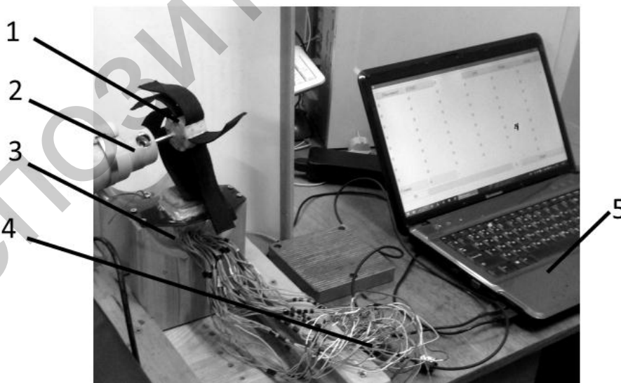
Рис. 1 – Фотография общего вида экспериментального комплекса

На рисунке 1 показана фотография общего вида экспериментального комплекса примененного в исследованиях. Насадка с токопроводящими лопастями 1, приводимая во вращение при помощи электродвигателя 2, взаимодействует с имитатором кожного покрова человека 3. Электроды имитатора подключены к плате с микроконтроллером 4, управление которой совершается при помощи ПК 5. На рисунке 2 показана структурная схема программно-аппаратного комплекса.