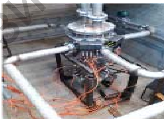
Рисунок 2 – Общий вид экспериментальной модели

Экспериментальная модель (ЭМ) представлена на рис. 2. Экспериментальная модель оснащена четырьмя патрубками ввода теплоносителя, по одному из которых подается соленый поток, по трем другим дистиллированная вода. Теплоноситель проходит от входных патрубков ЭМ вниз по опускной кольцевой камере, попадает в нижнюю напорную камеру, откуда распределяется по дросселированным каналам имитаторам активной зоны. По окончании подъема в каналах имитаторов теплоноситель выходит в верхнюю сливную камеру и удаляется из модели через два выходных патрубка в крышке.