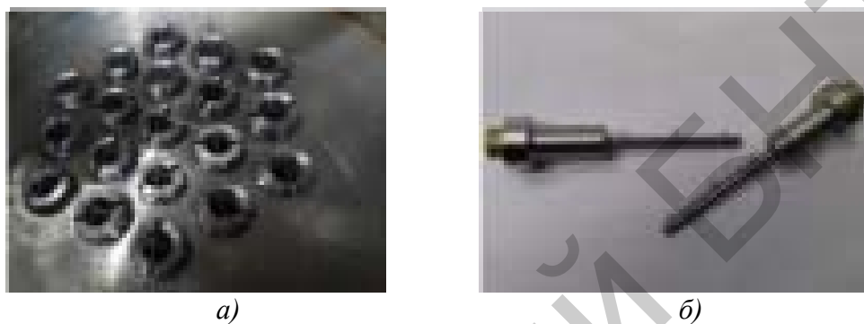
Рисунок 3 – Исследовательская часть измерительной системы: а – сетчатый датчик (верхняя камера), б – стержневые датчики

Датчики установлены на всем протяжении опускной камеры экспериментальной модели (в трех плоскостях с азимутом 20^\circ между соседними датчиками), а также на входе и выходе из области, имитирующей каналы активной зоны. Характеристики измерительной системы дают возможность получать частотно-энергетические характеристики флуктуаций значений локальной концентрации для последующего восстановления спектра турбулентных пульсаций в потоке.